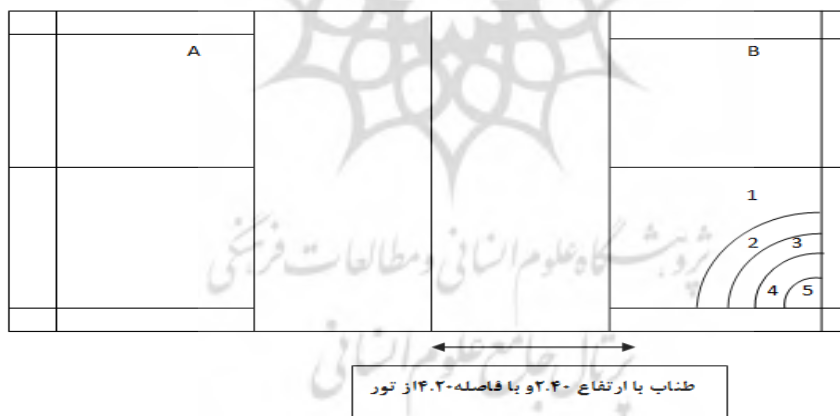
شکل ۱. جهت زدن سرویس

سانتی‌متر از نقطه تقاطع خط طولی و عرضی زمین یک نفره رسم می‌شوند. خطوط دو سانتی‌متری جزو دایره محسوب می‌شوند. مطابق شکل یک آزمون‌شونده در نقطه (A) در قطر زمین مخالف با دایره‌ها قرار می‌گیرد و تلاش می‌کند توپ را با سرویس بلند از روی طناب به سمت آن‌ها بفرستد. هر دایره دارای امتیاز مشخصی در شکل است. برای این آزمون ۲۰ سرویس انجام شده است. امتیازگذاری بدین‌صورت است که هر توپ که روی خطوط دایره فرود آید، امتیاز دایره کوچک‌تر را کسب می‌کند و امتیاز فرد، مجموع امتیازها از بیست سرویس انجام‌شده است. امتیازدهنده باید عبور توپ از روی طناب و فرود آن را روی دایره‌ها به‌خوبی مشاهده کند و نیز امتیاز را با صدای بلند به آزمونگر اعلام کند.