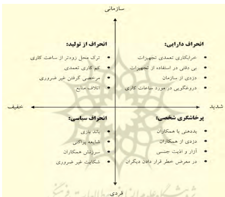
شکل ۱. نوع‌شناسی رفتارهای انحرافی در سازمان (رایبسون و بنت، ۱۹۹۵)

انحراف سیاسی زمانی روی می‌دهد که کارکنان از سهام‌داران خاص حمایت کنند که در این صورت دیگران در معرض مضراتی قرار می‌گیرند. چنین حمایت‌هایی ممکن است هزینه‌هایی ایجاد کنند که ناشی از کیفیت بی‌ثبات خدمات، نارضایتی و احساس بی‌عدالتی باشد. انحراف شخصی شامل خصومت و رفتارهای