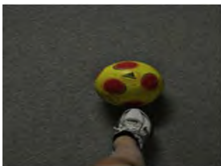
تصویرسازی دیداری درونی (دید اول شخص)