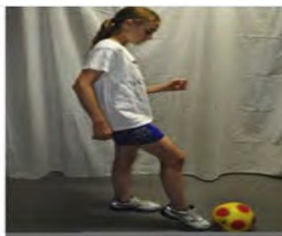
تصویرسازی دیداری بیرونی (دید سوم شخص)