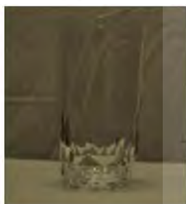
لیوان خالی (احساس یا دیدن ..... بسیار آسان بود)