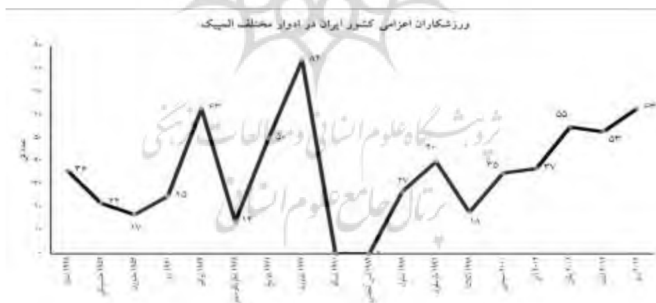
شکل ۴- مجموع ورزشکاران اعزامی کشور ایران در ادوار مختلف المپیک

شکل شماره چهار تعداد ورزشکاران اعزامی کشور ایران را در ادوار مختلف المپیک نشان می‌دهد.