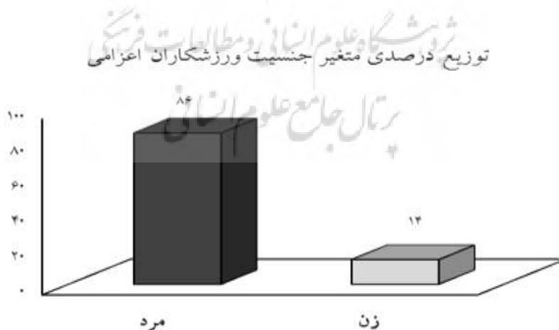
شکل ۲- جنسیت ورزشکاران اعزامی به المپیک ۲۰۱۶ ریو

با توجه به نتایج به دست آمده، میانگین و انحراف استاندارد سن ورزشکاران به ترتیب 26/96 \pm 5/15 بود. شکل شماره دو توزیع فراوانی جنسیت ورزشکاران حاضر در المپیک ۲۰۱۶ ریو را نشان می‌دهد.