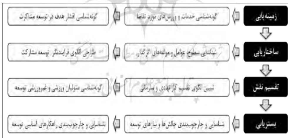
شکل ۱- چهارچوب تحلیل مفهومی پژوهش

مدل‌های توسعه‌ی زیادی در زمینه‌ی ورزش همگانی ارائه شده‌اند؛ اما تاکنون مدل و الگوی جامعی که بر توسعه‌ی مشارکت ورزشی تأکید کند، ارائه نشده است. به‌ویژه اینکه در استان گیلان، تاکنون چنین مطالعاتی باوجود برخورداری این استان از شرایط اقلیمی مناسب برای پرداختن به انواع الگوهای ورزش همگانی و تفریحی انجام نشده‌اند. به‌طورکلی، نتایج پژوهش‌های انجام‌شده در ورزش استان‌های کشور نشان داده است که فقدان سیاست‌ها، خط‌مشی‌های راهبردی، نبود هماهنگی بین مجموعه‌ی نهادها، سازمان‌ها و دستگاه‌های اجرایی مرتبط با ورزش، ناکافی‌بودن منابع مادی و انسانی در حوزه‌های مختلف ورزشی، گاهی انجام کارهای موازی و نبود نظارت کافی بر فعالیت‌های ورزشی، از جمله مهم‌ترین نارسایی‌های این بخش محسوب می‌شوند؛ بنابراین، پژوهش حاضر درصدد است که براساس مطالعه‌ای تفصیلی و جامع با رویکرد پیمایشی و زمینه‌ای در سطح مشارکت ورزشی استان گیلان، به نظام‌مندسازی منظرها و رویکردهای توسعه‌ی مشارکت ورزشی بپردازد. چهارچوب تحلیل مفهومی و محتوای پژوهش، در قالب سه رویکرد اصلی زمینه‌یابی، ساختاریابی و چهارچوب‌بندی عامل‌ها، شاخص‌ها و رویکردهای توسعه‌ی مشارکت ورزشی، به‌صورت شکل شماره ۱ یک ترسیم شده است. این چهارچوب، حاصل نظام‌مندسازی محتوا و فرایند این پژوهش براساس اصول پژوهش در مدیریت ورزشی است.