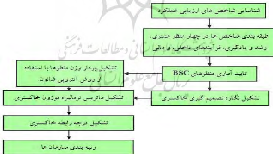
شکل ۲- مدل ارزیابی و رتبه بندی سازمان ها براساس روش BSC - GCA

برای گزینه های I = \{1, 2, \dots, m\} ، p, q اگر \Gamma_p > \Gamma_q باشد، آن گاه نتیجه گرفته می شود که مطلوبیت گزینه p بیشتر از گزینه q است؛ بنابراین، براساس نتایج حاصل از جدول شماره هفت، در مقایسه بین اداره های ورزش و جوانان استان اصفهان (نمونه های مورد مطالعه)، اداره ورزش و جوانان شهرستان نجف آباد در رتبه اول، اداره ورزش و جوانان شهرستان اصفهان در رتبه دوم و اداره ورزش و جوانان شهرستان شاهین شهر در رتبه سوم قرار گرفتند. همچنین، سایر اداره های مورد مطالعه رتبه بندی شدند. شکل شماره دو در قالب یک مدل، نمایشگر مجموع مراحل پیموده شده است.