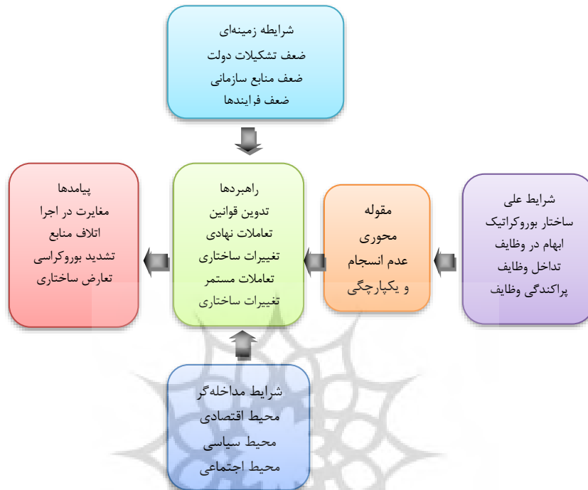
شکل ۱- مدل پارادایمی آسیب‌شناسی ساختار ورزش ایران (مبتنی بر کدگذاری محوری)

شکل شماره یک کدگذاری محوری و به‌عبارت‌دیگر، مدل فرایند کیفی آسیب‌شناسی ساختار ورزش ایران است.