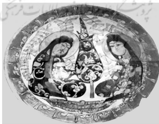
شکل ۴: کاسه سفال مینایی زراندود قرن (۶ و ۷) - مکشوفه از ری