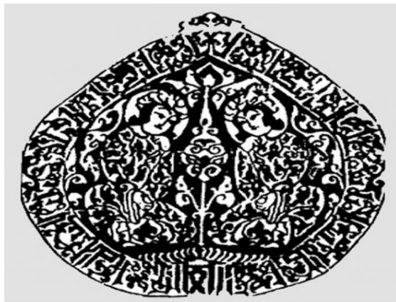
شکل ۲: دو فرشته با کتیبه کوفی