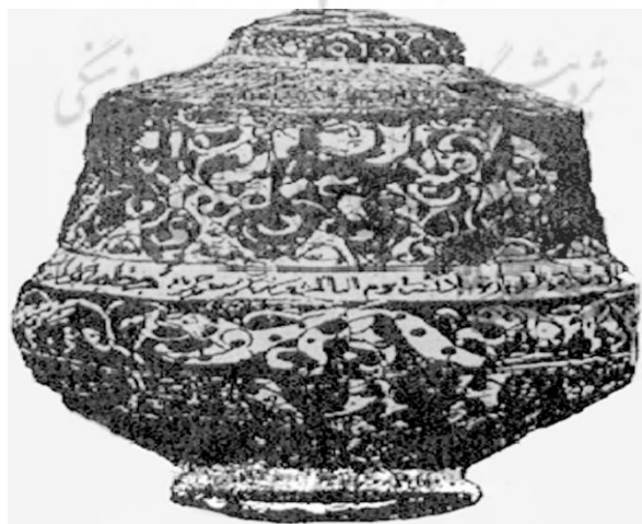
شکل ۵: کوزه با لعاب پوشش‌دار- نقاشی هفت‌رنگ مینایی - قرن ۶ (ق.) - موزه بریتانیا

اما نکته شایسته درنگ، همانندی تصویر نقاشی شده روی گلدان راغه با دوشیزه اثیری است که انگاره سلجوقی بودن این دوشیزه را تقویت می‌کند.