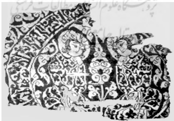
شکل ۱: پارچه ابریشمی - قرن ۵ (ق.) - سبک ری