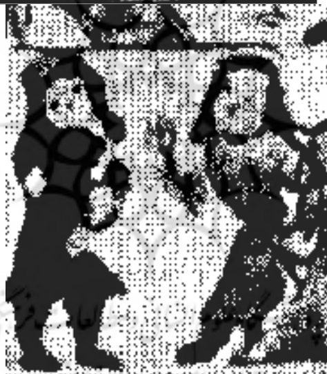
شکل ۷: تنگ سفالی مینایی داستان بیژن و منیژه از مینیاتورهای دوره اسلامی که از نقوش پیش از اسلام اقتباس شده است (بیژن در حال تعارف یک دسته گل به منیژه است).

از دیگر نشانه‌هایی که نجیب‌زاده یادشده و دوشیزه اثیری را پیوند می‌دهد، لباس و نوع پوشش این دو شخصیت است. او «لباس سیاه چین خورده‌ای پوشیده... که قالب و چسب تنش [است]... لباس او از تار و پود پشم و پنبه معمولی نبوده و دست‌های مادی، دست‌های آدمی آن را ندوخته... لباس سیاه نازکی که مثل تار عنکبوت او را در میان خودش محبوس