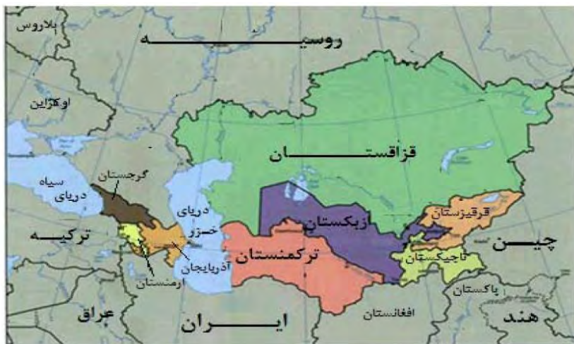
نقشه ۲. موقعیت ژئوپلیتیکی کشورهای آسیای مرکزی در هم‌جواری با ایران