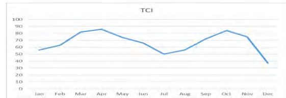
شکل شماره ۳: توزیع نقاط اوج TCI شاهرود