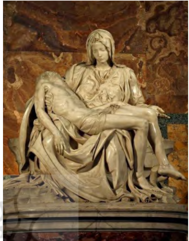
تصویر ۱. راست : مجسمه سنگی پی‌یتا، واتیکان. چپ : پی‌یتای توبادزین (روستایی در لهستان)، موزه ملی ورشو لهستان، حدود ۱۴۵۰ م. رنگ حرارتی روی چوب.

به تبع آن در کلیساهای غربی کاربرد داشته است. از مرور یسنه‌ها ۲۶ چنین برمی‌آید که اهورامزدا ۲۷ (پدر) و سپندارمذ ۲۸ (مادر) جفتی بوده‌اند که فرزندی را پدید آورده‌اند که صورت مینویی‌اش ارته ۲۹ یا آشه (اردیبهشت) و صورت زمینی‌اش آذر بوده است؛ ازین‌رو است که آذر بارها و بارها با لقب پسر اهورامزدا مورد اشاره واقع شده است. ۳۰ این خانواده مقدس با صورتی آسمانی از سه طبقه اجتماعی همسان هستند؛ پدر خردمند آسمانی (اهورامزدا) با مغان، ایزدبانوی باروری و رویش (سپندارمذ) با کشاورزان و فرزند ایشان که پسری جوان و جنگ‌آور است با ارتشتاران. هنگامی که دین زردشتی با ادیان پیشین در هم ادغام شد این مثلث به گونه‌ای دیگر که اهورامزدا (پدر)، آناهیتا (مادر) و مهر (پسر) جلوه‌گر شد. همین خانواده مقدس که در دوران هخامنشی پیوند با سنت‌های پیشازردشتی دارد و در کتیبه اردشیر دوم چون مثلثی مقدس مورد اشاره قرار گرفت. «به یاری اهورامزدا، آناهیتا و میترا (ناهید و مهر)، فرمان دادم که این آپادانا ساخته شود» (زرین‌کوب، ۱۳۸۴: ۱۹۵). دلالت آسمانی این سه ایزد نیز در اخترشناسی ایرانی نهادینه شد و از این تمدن به سایر تمدن‌ها راه یافت چنانکه خورشید