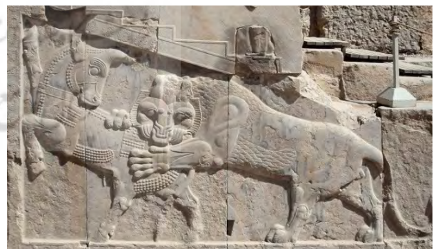
تصویر ۵. نبرد شیر و گاو، تخت جمشید.