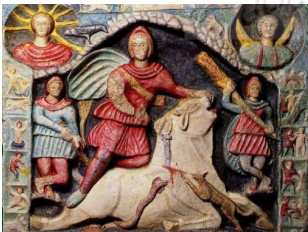
تصویر ۲. نقاشی دیواری از میترا در شهر مارینو- ایتالیا (قرن سوم).

همان‌گونه که گفته شد مهر ایزد حامی جنگجویان و جنگاوران بود و اساساً آیین مهر توسط سپاهی‌مردان ایرانی به سربازان رومی داده شد و ایشان اولین گروندگان غربی به آیین مهر بودند و همان‌گونه که گفته شد در جهان‌بینی ایرانی تجسم میترا نمادگرایانه بوده و از شمایل انسانی برای وی کمتر بهره می‌جستند؛ با نگاه به کتاب راهنمای رژه ارتش ایران این ایزد بزرگ جنگاوران در پرچم‌ها و درفش‌ها و تزیینات روی لباس سپاهیان ایرانی به شکل شاهین منقوش بوده است (تصویر ۱۳).