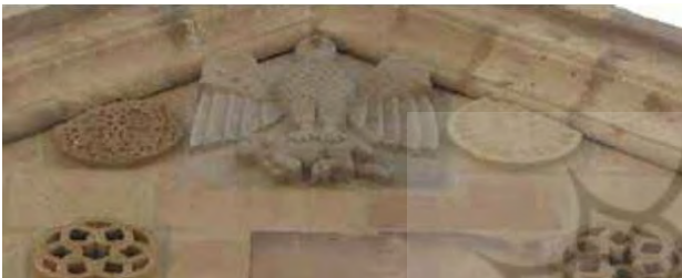
تصویر ۷. عقاب در حال شکار گاو. کلیسای سنت استپانوس. عکس: گلنار کشاورز، ۱۳۸۹.