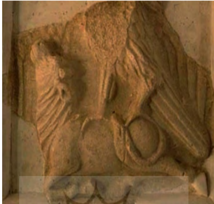
تصویر ۹. شکار گاو به دست شاهین، قلعه ضحاک در آذربایجان شرقی، مأخذ: http://faza-falamaki.com - 24.March.2018