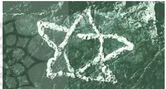
تصویر ۴. ستاره مهرپرستی.