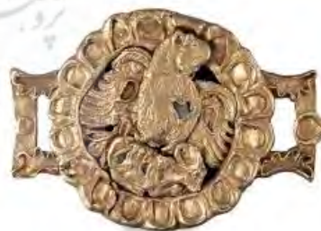
تصویر ۱۴. قطعه‌ای از یک کمر بند اشکانی با نقش عقابی که گاوی را با خود می‌برد؛ موزه متروپولیتن.

۹. در فلات ایران شامل ایران کنونی و منطقه قفقاز به خصوص ارمنستان زمینه اصلی آیین مهر که قربانی مقدس گاو است به گونه‌ای تصویرسازی شده است