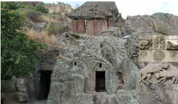
تصویر ۶. نبرد شیر و گاو، ارمنستان. عکس: احسان دیزانی، ۱۳۹۲.