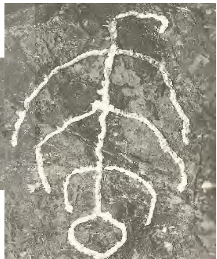
تصویر ۱۰. علایم و نقوش حجاری شده بر سنگ‌های لاشه‌ای معبد آناهید کنگاور به ترتیب از چپ به راست، تصویر عقاب، تصویر یک گاو و تصویر یک عقاب که گویا جسمی را شکار کرده و به سمت بالا می‌برد، عکس: کامبخش فرد، ۱۳۷۴.

می‌توان در تزیینات داخل کلیساهای شرق و غرب دید؛ برای نمونه اثری به نام پی‌تا که در کلیساهای غربی به وفور دیده می‌شود اما در کلیساهای شرقی اثری از آن نیست و علت آن باز می‌گردد به تأثیر باور و تجسم خداوند در کالبد انسانی در مهرپرستی غربی (میتراهی گاوکش شمایل انسانی دارد) که حاصل این اثربخشی می‌شود تجسم مسیح خون‌آلود در آغوش مادر و علت نبود چنین تصویری