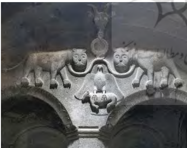
تصویر ۸. تعقاب در حال شکار گاو کلیسای گفارد، ارمنستان. عکس: سید امیر منصور، ۱۳۹۲.

که میترا به شکل انسان ظاهر می‌شود و گاو را قربانی می‌کند؛ باید در جهان‌بینی شرقیان و غربیان جست، زیرا در جهان یونانی و رومی (غربی) خدایان را در کالبدی انسانی تجسم می‌کردند و حتی بر ایشان صفات انسانی قائل بودند [مانند خدایان المپ ۴۰ ]. اما در جهان‌بینی ایرانی چنین نبود و بیشتر قدرت‌های ایزدی به شکل نمادین تصویر می‌شدند. همان‌گونه که این تفاوت‌های