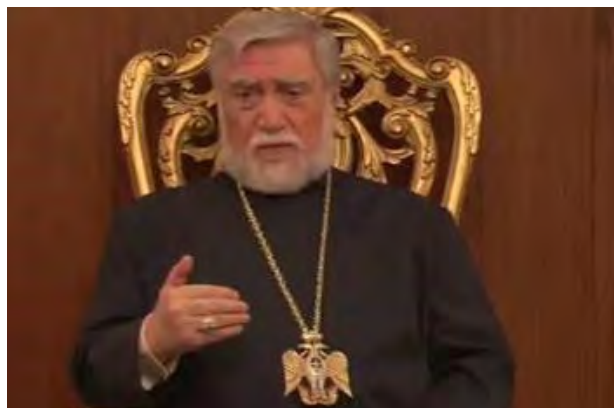
تصویر ۱۱. شاهین شکارگر به شکل گردنبندها بر گردن اسقف‌های ارمنی.