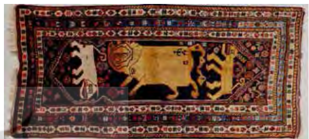
تصاویر ۶ و ۷. قالی بلوچ خراسان با نقش دوسکومی در متن و حاشیه. مأخذ: