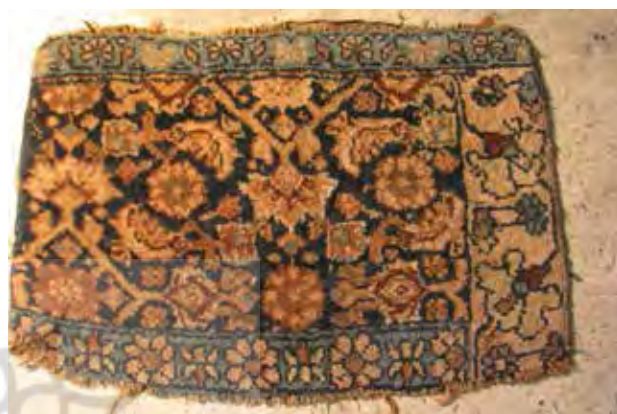
تصویر ۸. اورنگ (نقشه فرش) با طرح ماهی، افشار شمال غرب.

می‌کنند. نقشی که در طول تاریخ سرشار از تحول خود با ریشه مفهومی یکسان و تصاویر متنوع تاریخ سرزمین را پاس می‌دارد. از مهرابه‌های مهری با تصویرپردازی طرح محرابی در قالی‌های ایران نیز به عنوان نمادهای مهری صحبت به عمل می‌آید. محراب محل عبادت مسلمان در جهت قبله و در دین اسلام است و در عین حال با محل به جای آوردن مراسم مهرباوران در مهرابه‌ها هماهنگی دارد (تصویر ۸).