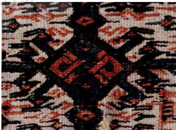
تصویر ۱۱. میترا هزار چشم ... نمکدان لری