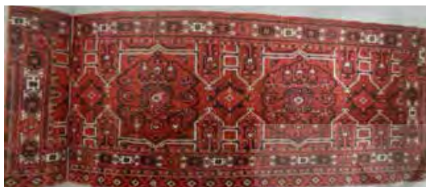
تصویر ۹. سالور گل، قالی ترکمن.

نقش‌پردازی این نقش با گل زرین چینی وجود دارد نیز حایز اهمیت است. گلی که جاوید است و به یگانه واحد باز می‌گردد. نوری که همراه با زندگی به اصل نور باز می‌گردد (ریچارد، ۱۳۷۱: ۳۹). رد نشانه‌های مهری در ارتباط با این نقش به باورهای معنوی اقوام ترکمن در ادوار زمانی قدیم بازمی‌گردد. شمن‌باوری در بین این افراد رواج داشته است. موارد مشابه در شمنیزم و باور مهری را می‌توان در اهمیت روح و اسب (الیاده، ۱۳۹۲: ۲۹۱)، هفت مرحله‌ی ورود روح به قلمروهای زیرزمینی (همان: ۳۱۶) و مشابهت اساطیر