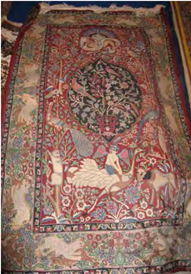
تصویر ۱۲. قالی کرمان، داستان مهر، شانزدهمین نمایشگاه فرش تهران.