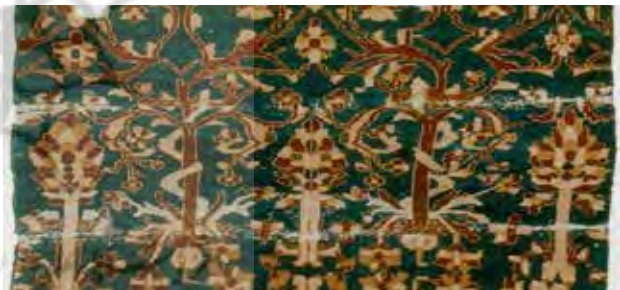
تصویر ۱۰. پاره قالی از مجموعه طاهر صباحی، عکس: صباحی، ۱۳۹۵.

نگهبانی از درخت حیات، در دامنه نقش‌پردازی‌های هنری در جهان پرآوازه است. از درخت حیات به عنوان مظهر هستی و گیتی و وجود انسانی تعبیر می‌شود که دوام آن احتیاج به نگهبانی دارد. مراقبت از آن گاهی با نمادهای انسانی، گاهی حیوانی و گاهی گیاهی تصویر می‌شود. اسب از جمله حیواناتی که نمادی از مهر محسوب می‌شود و نقل شده که در مراسم مربوط به آیین مهرگان، احتمال قربانی شدن آن برای مهر وجود داشته (دوشن‌گیمن، ۱۳۸۵: ۲۴۰) در برخی نقوش تصویر شده بر قالی ایرانی به تعبیری در دوسوی نمادی که شاید مظهری مهری نیز باشد، از این نماد محافظت می‌کند. اسب سپید را نمادی از تیشتر یا باران نیز دانسته‌اند که در ایران بعد از ساسانی، روحی تشبیه شده به