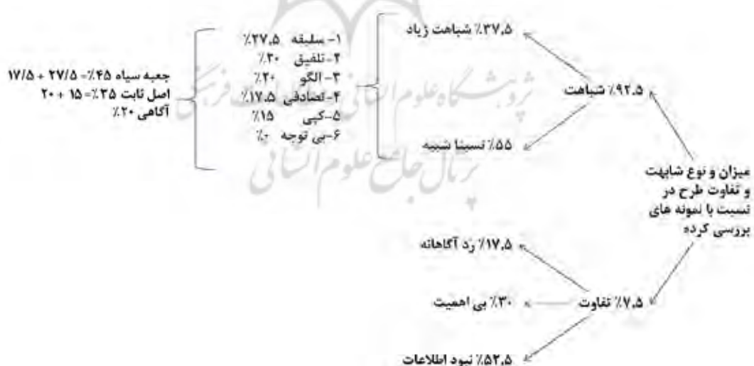
تصویر ۲. نمایش میزان و نوع اندیشه و فرایند موجود در توازن شباهت و تفاوت طرح با نمونه.

«فرصت اندیشه» را از میان برده و تنها در دهه‌های اخیر بر این اثر سو آگاهی به وجود آمده است. مصرف و مشتری بودن از برند یا سبکی خاص نوعی تفاخر است. در نتیجه «مصرف از یک هجمه» ارزشمند تلقی می‌شود. در واقع متخصص با نمایش توان مصرف خود از اندیشه‌ای پر هجمه و پیوستن به آن - که جایگزینی در