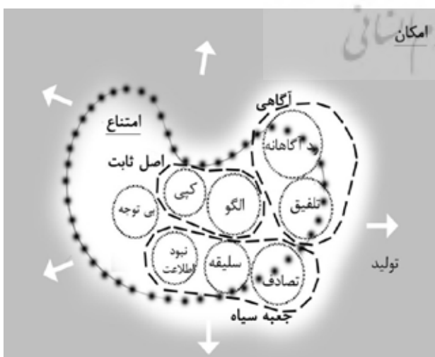
تصویر ۳. جدال تولید و تقلید.

هرچند مسیر خروج از «امتناع» و ورود به «عالم امکان»، «تکوینی» است و از پیش «امری انتزاعی» نمی تواند آن را تبیین کند، از مهم ترین علل این نوع زوال یا جدال تولید و تقلید که اندیشه طراحی آکادمیک را در سطح «تلفیق» (بومی سازی)، «الگو» (آنچه خود داشت، تصلب و شیفتگی متناظر با ایران، اسلام و