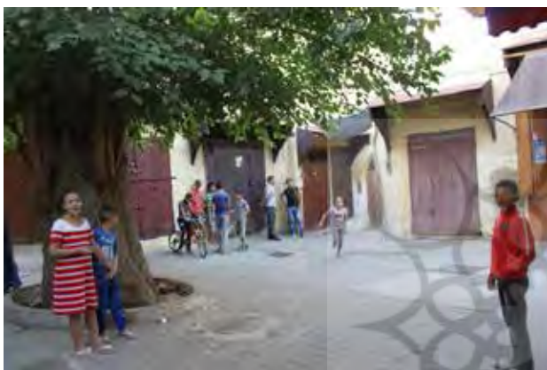
تصویر ۴. یکی از مراکز محلات شهر «مکناس» که با ساکنان اطراف از طبقه متوسط جامعه شهری تداوم زندگی را در خود دارد.

مردم با بالا بردن قیمت زمین و فروش و کسب درآمد حاصل از آن به دنبال زندگی مجلل و بهتر به خارج از این بافت‌ها بروند. همچنین فراهم ساختن امکان اشتغال در داخل همین مدینه‌ها مانع از رفتن جوانان به محلات جدیدتر و کسب درآمد از آنها شده که این موضوع نیز در ادامه مهاجرت دائم آنها را به دنبال داشته باشد. بدین ترتیب برقراری توازن بین ابعاد مختلف فرهنگی و معیشتی در مدینه‌ها توانسته است با حفظ کالبد آنها، زندگی و سکونت شهروندان را نیز تداوم بخشد.