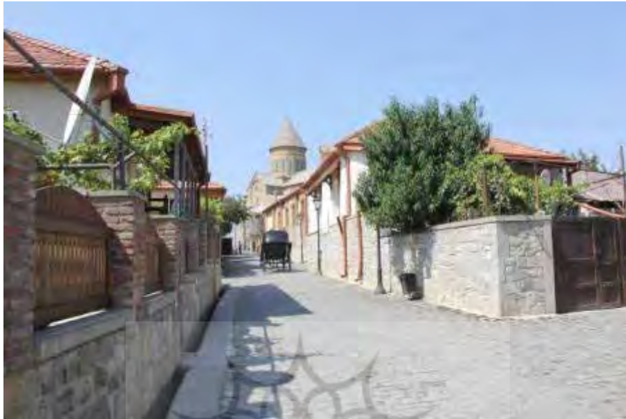
تصویر ۱. نمایی از معابر مرمت شده شهر متسختا که با رویکرد گردشگری آن را تبدیل به شهری موزه‌ای و غیرزنده کرده است.

بسیاری از شهرها، حضور بازاریایی است که مایحتاج روزانه مردم را تأمین می‌کنند. این در حالی است که در بسیاری از بازارهایی که با رویکرد گردشگری صرف بازسازی و مرمت شده‌اند، راسته‌های بازار به مسیرهایی برای ارائه سوغاتی‌ها و صنایع دستی که غالباً مورد استفاده گردشگران قرار می‌گیرد تبدیل شده است. نکته دوم در مرمت بازارهای سنتی، حفظ ارزش بافت پشت راسته بازار است. در بازارهای شهرهای «فاس»، «مراکش» و «مکناس» با نفوذ در بافت و رسیدن به محدوده‌های مسکونی همان ارزش فضایی که در بازار احساس می‌شد در فضاهای مسکونی نیز وجود داشت، این اتفاق نیز در حالی است که در شهرهای تاریخی ما، هم‌ارز بودن اهمیت بافت تجاری راسته بازار با بافت مسکونی پشت راسته بازار دیده نمی‌شود و هر اندازه قیمت کاربری تجاری در بافت تاریخی بالا رفته، از ارزش بافت مسکونی پشت آن کاسته شده است. این دو نکته در شهرهای مراکش هر دو به دلیل بازی دادن جریان زندگی و خود شهروندان در سناریوی مرمت بافت و احیای بازارهای سنتی در شهرهای بزرگ