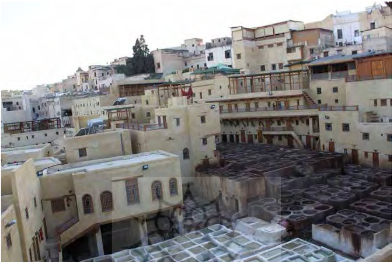
تصویر ۲. دباغ‌خانه‌ها در مراکش به عنوان یکی از محل‌های تولیدات سنتی که محل کار قشر خاصی از مردم است در بطن بافت تاریخی مدینه «فاس» حفظ شده و از نقاط فعالیت در این بافت است.

مراکش قابل توجه است که ساکنان مدینه‌ها شهروندانی درجه دو یا در حاشیه نیستند. از طرف دیگر نیز مشاغل و معیشت ساکنان این مدینه‌ها در مقیاس نیاز و کارکرد همین بافت‌هاست و افراد برای گذران زندگی مجبور به رفتن به بخش‌های دیگر شهر نیستند (تصویر ۴).