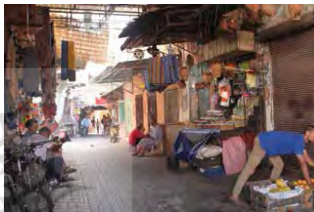
تصویر ۳. نمونه ای از بازارهای سنتی در مدینه شهر «مراکش» که به تأمین مایحتاج مورد استفاده ساکنان مدینه می‌پردازد.

که این امر نیز حیات حقیقی جاری در شهر را می‌میراند و محدوده‌هایی را توریستی یا نمایشی می‌سازد. بنابراین آغاز روند افول زندگی واقعی در بافت‌های فرسوده و ادامه یافتن آن هم متأثر از وضعیت کیفی کالبدی آنهاست و هم متأثر از سبک زندگی و شیوه معیشت ساکنان در آن. اما آنچه در مدینه بیشتر شهرهای مراکش رخ می‌دهد برقرار شدن توازنی نسبی و منطقی بین همه عوامل اثرگذار بر کالبد و زندگی شهروندان است. افزایش وضعیت کیفی کالبد این مدینه‌ها سبب نشده که