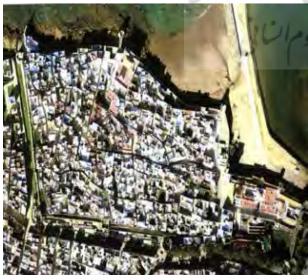
تصویر شماره ۲. عکس هوایی از بافت تاریخی شهر اصیله