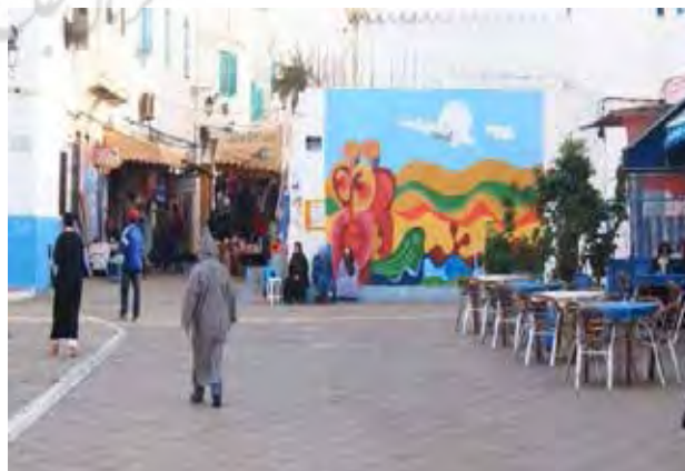
تصویر ۷. توجه به ایجاد فضاهای جمعی در بافت.

همان‌گونه که بیان شد باز زنده سازی بافت تاریخی اصیله با در اولویت قرار دادن صنعت گردشگری صورت پذیرفته است، در نتیجه چنین اقدامی، تأثیرات مثبت و منفی زیادی بر منظر بومی مدینه قابل بررسی است. امروزه شهر اصیله به‌عنوان یک مقصد گردشگری و شهری نمایشگاهی برای توریست‌ها از جذابیت فوق‌العاده‌ای برخوردار است. نکته شاخصی که با حرکت در گذرهای شهر به ذهن خطور می‌کند، فقدان حیات جمعی و زندگی فعال شهروندان بومی به گونه‌ای که در گذشته در جریان بوده است. در این شهر دیگر اثری از هویت بومی و سبک زندگی سنتی به چشم نمی‌خورد، با حرکت در معابر آن چیزی که بیش از همه به چشم می‌خورد خلوتی و سکوت بیش از حدی است که در نگاه اول، شهری غیرفعال را به چشم ناظر می‌آورد. برای توضیح بیشتر موضوع، در ادامه تأثیرات مثبت و منفی پروژه باز زنده سازی بافت تاریخی اصیله بر منظر بومی شهر بیان می‌شود. اگرچه در طرح با تأکید بر فضاهای جمعی، تلاش شده است تا سرزندگی بافت تأمین شود. آن چنان‌که طی بازدید از مدینه اصیله، ویژگی‌های مثبتی در بافت قابل‌شناسایی است. از این موارد می‌توان به بهبود وضعیت و نظم‌بخشی به فضاهای جمعی اشاره کرد، به‌گونه‌ای که درون بافت، فضاهای باز جمعی مشاهده می‌شود که هم منجر به ایجاد تعاملات اجتماعی شده و هم تراکم بافت تاریخی را تعدیل می‌نمایند. از دیگر موارد شاخص بازسازی معابر عمومی و اصلاح کف‌سازی آن‌ها است، به‌منظور زیباسازی بیشتر فضاهای شهری از یک الگوی موج مانند (نوعی اشاره به اقیانوس که شهر در ساحل آن شکل گرفته نیز دارد) در کف‌سازی اغلب خیابان‌ها الهام گرفته شده است. از دیگر موارد مثبت قابل ذکر، بهبود سیمای شهری و بهبود وضعیت