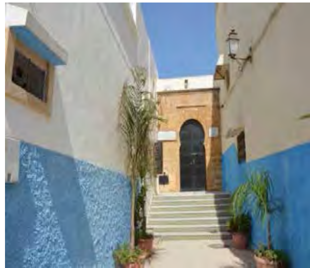
تصویر ۹. تنوع معماری در بافت تاریخی. عکس: سهیل اسکندرزاده، ۱۳۹۵.