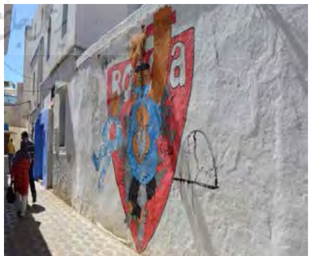
تصویر ۶. نقاشی‌های دیواری که در جداره‌های شهری خودنمایی می‌کند.

به‌عنوان شهری موزه‌ای و مقصدگردشگران و ساکنین غیربومی که برای گذران اوقات فراغت به شهر مراجعه می‌کنند، مطرح است. در جریان باز زنده سازی مدینه اصیله، المان‌های تاریخی و ابنیه مدینه مورد بازسازی قرار گرفت، علاوه بر آن توسعه زیرساخت‌ها و تجهیزات شهری از دیگر مواردی است که در شهر به چشم می‌خورد. در سطح مدینه دسترسی‌ها اصلاح و پارکینگ‌های عمومی پیش‌بینی شده است (Ibid). با حرکت در گذرهای خلوت شهر، نقاشی‌های دیواری بر روی جداره‌های سفید شهر به وضوح خودنمایی می‌کند و حاکی از تأثیرات فستیوال هنری کشور مراکش و توسعه فعالیت‌های اجتماعی - اقتصادی است. از دیگر مواردی که در بافت مدینه می‌توان به آن اشاره کرد توسعه گردشگری و فرهنگ است به گونه‌ای که فعالیت‌های مرتبط با صنعت گردشگری نظیر احداث هتل‌ها، کافه‌ها و رستوران‌ها و غرفه‌های فروش صنایع‌دستی و ... از موارد قابل ذکر می‌باشند.