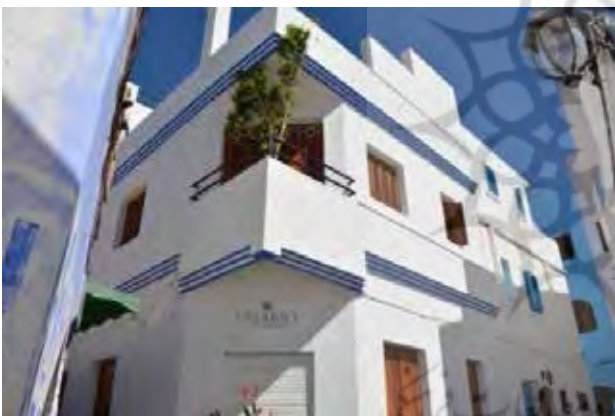
تصویر ۱۱. اختصاص کاربری‌های متناسب با صنعت گردشگری در بافت.