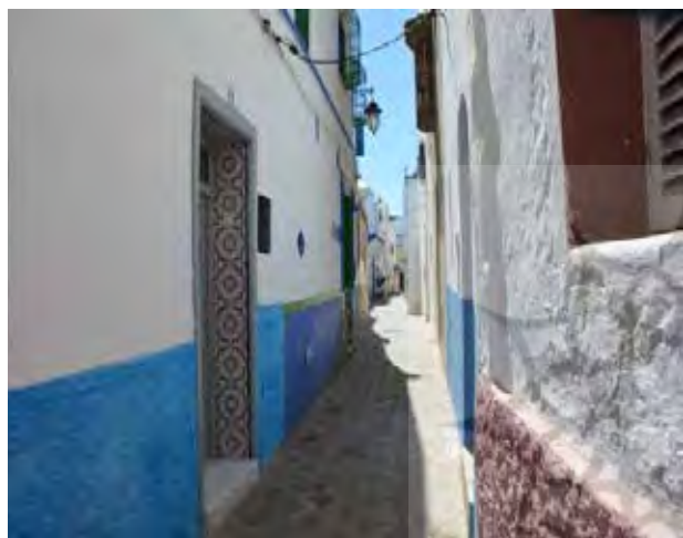
تصویر ۴ و ۵. گذرهای خلوت مدینه اصیله. عکس: سهیل اسکندرزاده، ۱۳۹۵.

پروژه باز زنده سازی بافت تاریخی اصیله پروژه باززنده‌سازی بافت تاریخی اصیله در سال ۱۹۷۸ آغاز شد. در این پروژه سایت‌های تاریخی مانند حصار پرتغالی‌ها، برج الکمرای ۴ و قصر ریسونی ۵ به صورت کامل بازسازی و بسیاری از فضاهای عمومی جهت عملکردهای تجاری باززنده‌سازی شدند. کف سازی خیابان‌ها اصلاح شد و خانه‌های تاریخی مطابق الگوهای سنتی بازسازی شدند. در سال ۱۹۸۹ طرح احیاء و بازسازی اصیله موفق به کسب جایزه آقاخان شد و توجه به هماهنگی ساختمان‌ها با بافت مسکونی و ایجاد رابطه متقابل بین مهارت‌های محلی و بیرونی از دلایل کسب این جایزه اعلام شد (El Harrouni, 2010). امروز در نتیجه این برنامه احیاء و بازسازی، مدینه شهر بیشتر