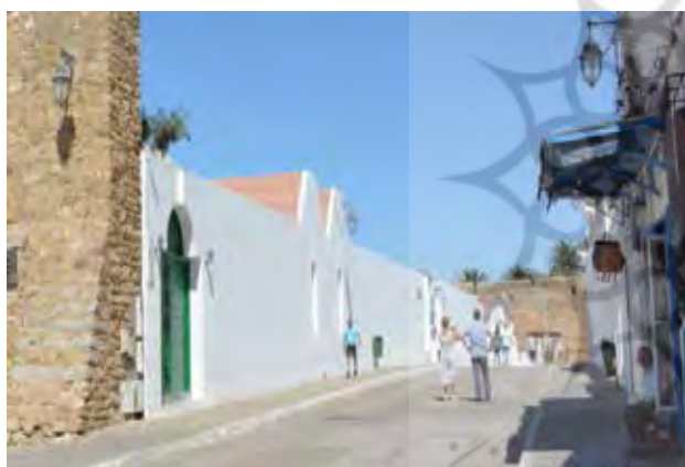
تصویر ۱۴. نمایش شدن بافت تاریخی. ۱۳۹۵.