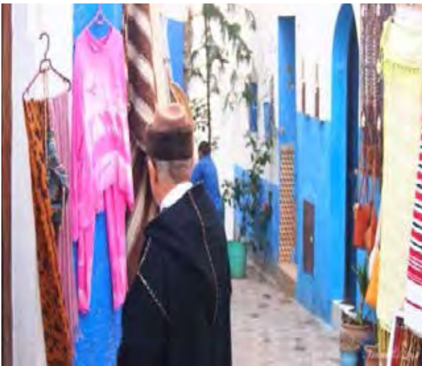
تصویر ۱۰. استقرار واحدهای فروش صنایع دستی در بافت. عکس: سهیل اسکندرزاده، ۱۳۹۵.