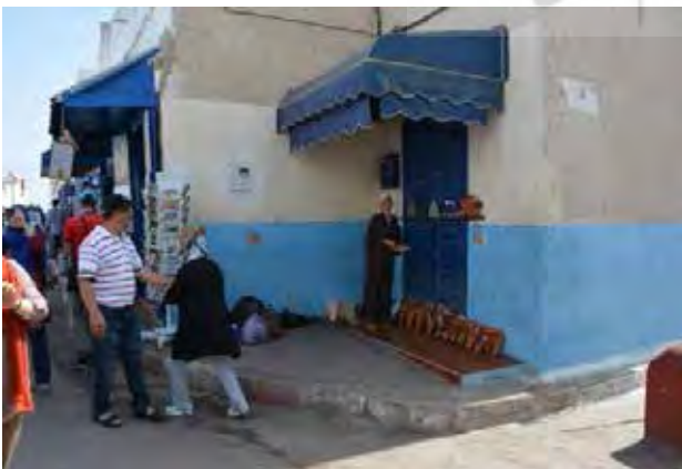
تصویر ۱۲. ایجاد کسب و کارهای مرتبط با صنعت گردشگری. عکس: سهیل اسکندرزاده، ۱۳۹۵.

از دیگر موارد که منجر به ایجاد تأثیرات مثبت بر بافت تاریخی شهر اصلیه شده است می‌توان به بهبود شبکه دسترسی اضطراری، ساخت و تدارک پارکینگ عمومی و ایجاد پیاده راه‌ها و فضاهای فراغتی اشاره نمود (Ibid). علاوه بر آن برگزاری مهم‌ترین فستیوال هنری مراکش در فصل تابستان در این شهر به تقویت جلوه‌های فرهنگی آن کمک نموده است و تأثیری مثبت در احیای فعالیت‌های مربوط به صنایع دستی و حفظ هویت فرهنگی منطقه داشته است. اگرچه برگزاری همین فستیوال که اصلیه را به مهم‌ترین مقصد هنرمندان عرب در سال تبدیل کرده است، خود نوعی اعتراض مردمی را در عدم بهره‌گیری از نیروها و منابع بومی به همراه داشته است (Eunice, Nd). از طرفی دیگر برگزاری این فستیوال تأثیرات مثبتی در بهبود وضعیت اقتصادی ساکنین و رونق پایه‌های اقتصادی مدینه از طریق ایجاد کسب و کارهای مرتبط با صنعت گردشگری داشته است. ایجاد کاربری‌های جدید نظیر هتل‌ها، رستوران‌ها، کافه‌ها، عملکردهای تجاری مربوط به فروش صنایع دستی، سازمان‌دهی تورهای گردشگری و ... همگی از عواملی هستند که منجر به ایجاد اشتغال و کسب درآمد برای ساکنین شده و به رونق اقتصادی شهر کمک می‌کند.