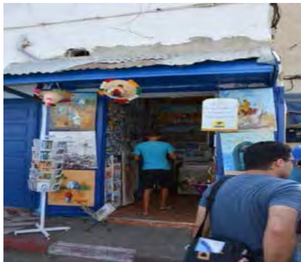
تصویر ۱۳. ایجاد اشتغال برای ساکنین. عکس: سپهیل اسکندرزاده، ۱۳۹۵.

قابل اشاره است. (The Aga Khan Award for Architecture, 1989) از دیگر تأثیرات منفی که باز زنده سازی مدینه اصیله به بار آورده می‌توان به کم‌رنگ شدن عرصه زندگی خصوصی ساکنین، ایجاد الگوهای نامناسب رفتاری به‌ویژه در میان جوانان، تغییر الگوی جمعیتی (افزایش مهاجر و کاهش جمعیت بومی) و نمایشی شدن زندگی مردم و آداب و رسوم سنتی اشاره نمود. علاوه بر آن، این پروژه در بعد اقتصادی نیز تأثیرات منفی را به بافت تحمیل کرده است که از جمله می‌توان به افزایش هزینه زندگی، افزایش قیمت زمین، نوسان درآمد، ورود افراد سودجو و ایجاد مشاغل کاذب و ... اشاره کرد (The Aga Khan Award for Architecture, 1989).