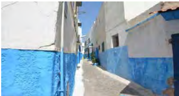
تصویر ۸. اصلاح کف‌سازی معابر. عکس: سهیل اسکندرزاده، ۱۳۹۵.

مناطق مسکونی از طریق بازسازی خانه‌های در معرض تخریب است. ساخت و سازهای مجدد صرفاً در محدوده‌های محصور با دیوارها امکان‌پذیر است. ابنیه جدید به همان سبک و سیاق بناهای تاریخی اسپانیایی و پرتغالی ساخته شده‌اند. تیرها و ستون‌ها از جنس بتن مسلح و در بعضی قسمت‌ها از دیوارهای باربر آجری بهره گرفته شده و سقف‌ها به‌وسیله تیرهای آهنی و آجرهای توخالی اجرا شده است. رایج‌ترین نوع مصالح برای دیوارها بتن و آجر توخالی است. نمای بیرونی از جنس سیمان با روکش نهایی آهک پوشیده شده است. عموماً از کاشی‌های با طرح سنتی و قطعات چوبی از درخت سدر برای بازسازی استفاده شده است. شایان‌ذکر است در بناهای موجود و قابل‌استفاده عملیات بازسازی و احیاء بناها با روش‌ها و مصالح سنتی صورت پذیرفته است (El Harrouni, 2000 & Eunice, Nd)