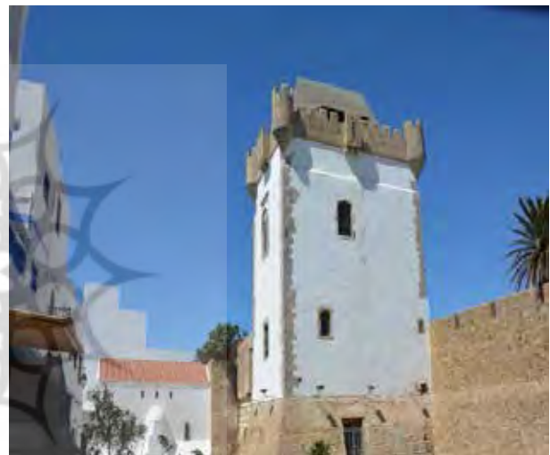
تصویر ۳. قصر ریسونی.

پروژه باز زنده سازی بافت تاریخی اصیله پروژه باززنده‌سازی بافت تاریخی اصیله در سال ۱۹۷۸ آغاز شد. در این پروژه سایت‌های تاریخی مانند حصار پرتغالی‌ها، برج الکمرای ۴ و قصر ریسونی ۵ به صورت کامل بازسازی و بسیاری از فضاهای عمومی جهت عملکردهای تجاری باززنده‌سازی شدند. کف سازی خیابان‌ها اصلاح شد و خانه‌های تاریخی مطابق الگوهای سنتی بازسازی شدند. در سال ۱۹۸۹ طرح احیاء و بازسازی اصیله موفق به کسب جایزه آقاخان شد و توجه به هماهنگی ساختمان‌ها با بافت مسکونی و ایجاد رابطه متقابل بین مهارت‌های محلی و بیرونی از دلایل کسب این جایزه اعلام شد (El Harrouni, 2010). امروز در نتیجه این برنامه احیاء و بازسازی، مدینه شهر بیشتر