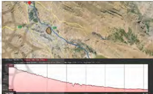
تصویر ۴. پروفیل طولی رودخانه خشک.