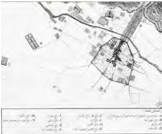
تصویر ۱. برخی از باغ‌های شیراز.

درکی، ۵. باغ رحمت‌آباد، ۶. باغ سالاری، ۷. باغ شیخ، ۸. باغ صاحب اختیار، ۹. باغ صفا، ۱۰. باغ صمد آقا، ۱۱. باغ عطا الدوله، ۱۲. باغ فتح آباد.