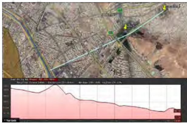
تصویر ۶. پروفیل طولی آبراه چشمه سعدی.

پژوهشگاه علوم انسانی و مطالعات فرهنگی رتال جامع علوم انسانی