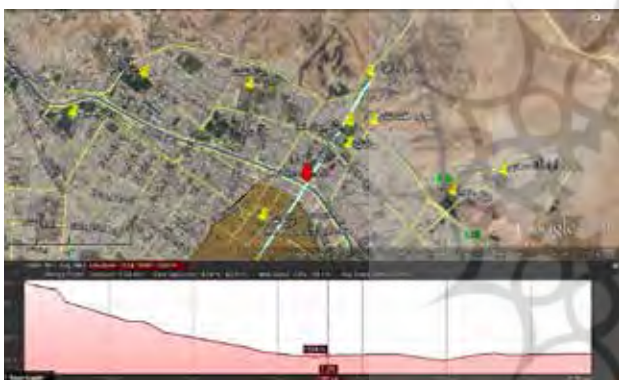
تصویر ۵. پروفیل طولی آبراه رکن آباد.