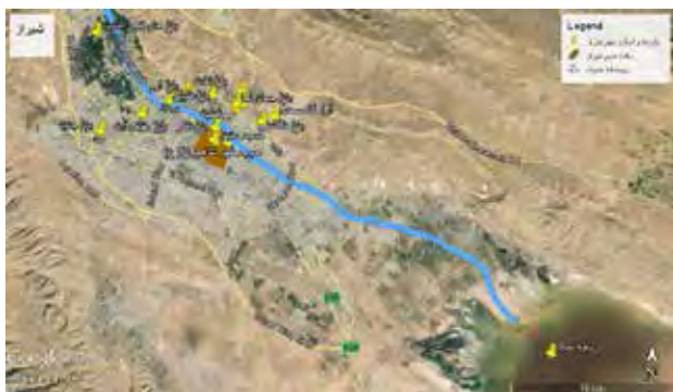
تصویر ۳. پراکندگی باغ‌های موجود شیراز.