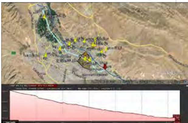
تصویر ۷. پروفیل طولی آبراه گویم.