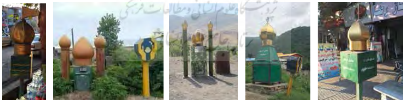
تصویر ۱۰. صندوق صدقات. عکس: شهره جوادی، ۱۳۹۵.

باید اذعان کرد که در موقعیتی دشوار، شرایطی فوق‌العاده پیچیده و نگران‌کننده قرار گرفته‌ایم. دولتیان، مجلسیان، قضائیان، نظامیان، معماران، مهندسان و در یک کلام طراحان و برنامه‌ریزان توسعه جامعه معاصر بعد انقلابی ما هنوز توجه چندان عمیق و جدی به پیچیدگی‌ها و دشواری‌ها و مخاطرات سخت و چالش‌های سنگینی که پیش‌روی جامعه معاصر ماست ندارند. طراحان و مهندسان معماری و فضاهای جامعه شهری ما آزاد و بی‌مهار هرچه می‌خواهند می‌سازند و هر آنچه را بتوانند ویران می‌کنند. شیوه عملی و عملکرد طراحان و مهندسان و معماران جامعه معاصر ما به هیچ وجه قابل قبول نیست. مبانی نظری آن‌ها، از بنیاد سست و غیر قابل قبول و تعریف نشده و غیر قابل توجیه است. به مقیاس جهانی نیز اساس کار چنین معمارانی بر فرم‌ها و باورهای رایجی استوار است که بر عموم مردم هر دم ناخوشایندتر می‌شود (آلسوپ، ۱۳۷۱: ۱۶). این نگرانی‌ها نسبت به هنر مدرن و امروزی است که از هنر با هویت و کاربردی گذشته فاصله گرفته و در نتیجه ارتباطش با مردم قطع شده است. غم‌انگیزتر و فاجعه‌بارتر از همه این است که معماری گذشته و به‌خصوص اماکن و بناهای