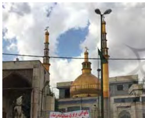
تصویر ۵. مسجدی در مسیر جاده فیروزکوه - شیرگاه