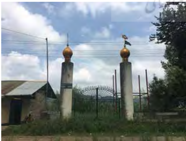
تصویر ۹. ورودی گورستان. شیرگاه، مازندران. عکس: شهره جوادی، ۱۳۹۵.

حتی تعریف ما از جنبه‌های کاربردی این بناها و فضاها و بافت‌ها درست و دقیق نیست. اینکه آیا فضا باید کاربردی باشد؟ اگر پاسخ مثبت است، در خدمت چه کسی و به نام چه غایتی؟ ..... زشتی ناگزیری که از هر سو به ما هجوم می‌آورد... (همان: ۸۷). زشتی