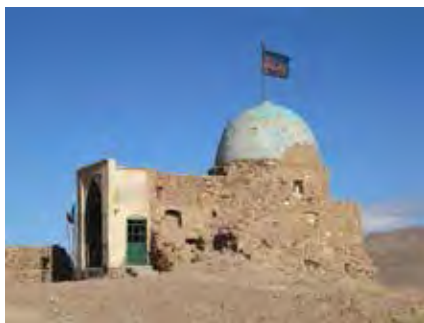
تصویر ۲. زیارتگاه شیخ اندرآبی، کیش