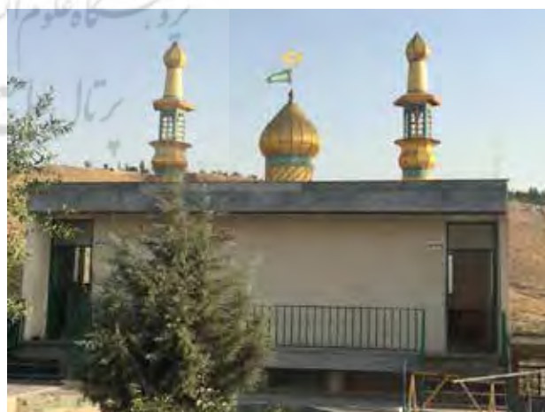
تصویر ۶. مسجدی در استان مازندران. عکس: شهره جوادی، ۱۳۹۵.