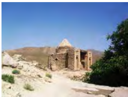
تصویر ۳. امامزاده علی. فاروج، خراسان شمالی