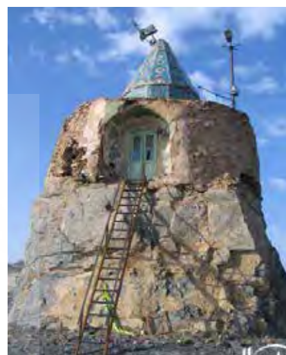
تصویر ۴. امامزاده عبدالله. روستای تار، نطنز