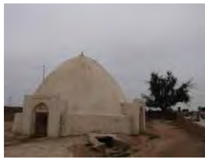
تصویر ۱. زیارتگاه صالح پیامبر. ابرکوه، یزد