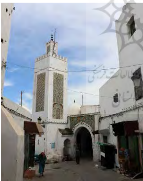
تصویر ۴. مسجد و بازار از عناصر اصلی تشکیل‌دهنده مدینه‌ها هستند. مسجد نیز علاوه بر کارکرد مذهبی، در ارتباط با بازار، مفصلی کالبدی است برای اجتماعات مردمی. مدینه تطوان. عکس: میثم خلیل‌پور، ۱۳۹۵.

شهرهای اسلامی و رومن هستند و در میان بافت عروقی و پیچیده شهر عناصر اسلامی معنا یافته و شهری چند مرکزی به وجود آمده است که در قلمرو خود در بافت اطراف نقش ایفا می‌کند. بر این اساس کالبد شهر برگرفته از نیاز به برقراری امنیت و غلبه فرهنگ رومن شکل یافته و مفهوم آن بر اساس اندیشه اسلامی و با همنشینی بعد مادی و معنوی شکل گرفته است.