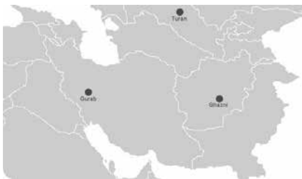
تصویر ۹. رویشگاه‌های امروزین سوسن. مأخذ: نگارندگان.