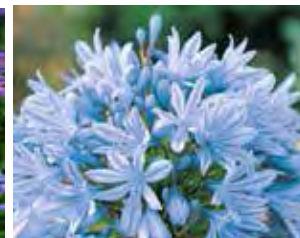
تصویر ۱۳. این نقش‌مایه برگرفته از گل سوسن یا زنبق است، که در فرانسه به نام زنبق مشهور است. ریشه این نقش‌مایه، ایرانی و از هنر ساسانی به امپراطوری روم رفته است. (جوادی، آورزمانی)