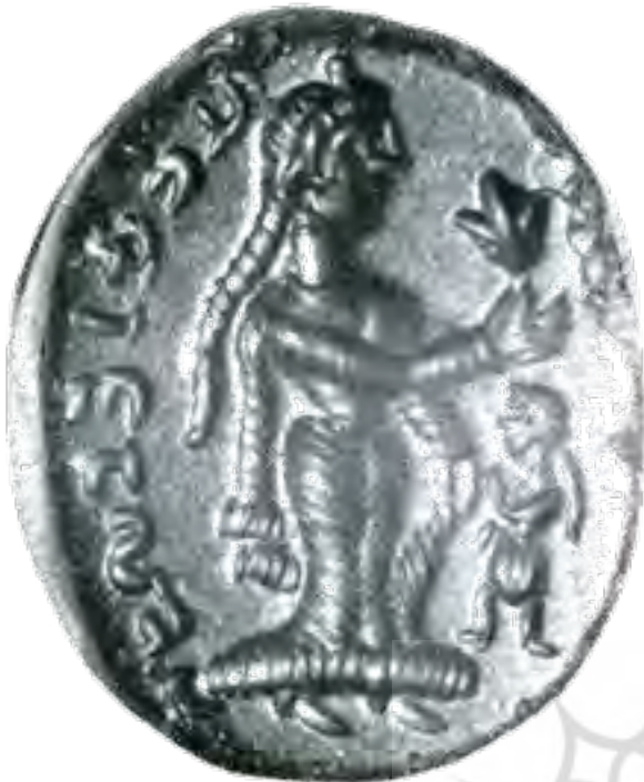
تصویر ۴. مَهر دوره ساسانی، دوشیزه‌ای با گل سوسن در دست.