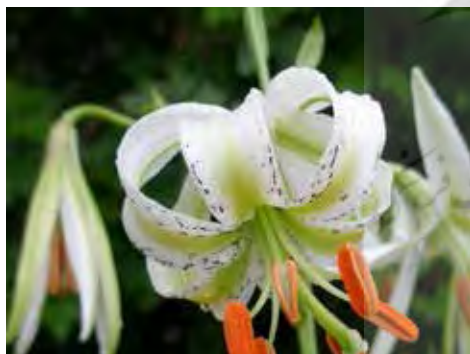
تصویر ۱. سوسن لانگیفلوروم.