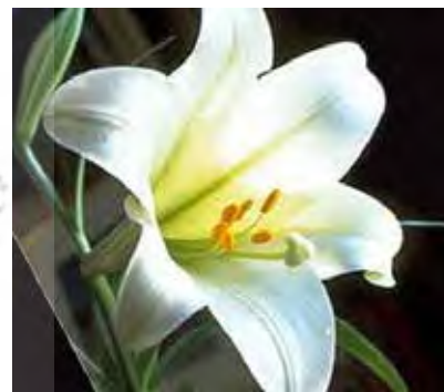
تصویر ۳. گل سوسن سپید یا آزاد: نماد جشن خردادگان.