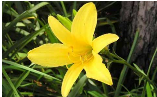
تصویر ۱۰. زنبق رشتی یا زنبق زرد یا Hemerocallis lilio که مشابهت زیادی با سوسن دارد.