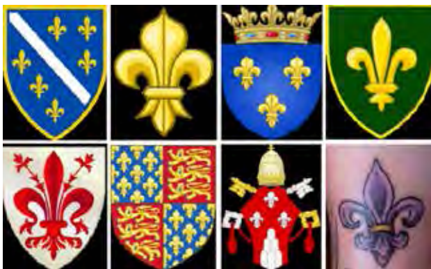
تصویر ۱۱. نماد سوسن یا زنبق بر نشان‌های حکومتی و خانوادگی در کشورهای اروپایی.