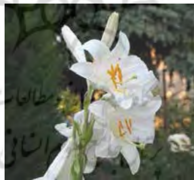
تصویر ۲. گل سوسن چلچراغ، در روستای داماش. تصویر ۳. گل سوسن سپید یا آزاد: نماد جشن خردادگان.