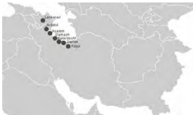
تصویر ۸. رویشگاه‌های باستانی سوسن بر اساس متون شعری.