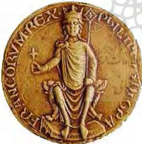
تصویر ۵. آگوستوس فیلیپ دوم، شاه فرانسه با گل سوسن در دست.