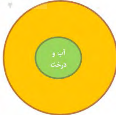
متن: گلدان حاشیه: آب و درخت