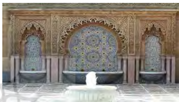
تصویر ۲. حضور آب در فرم‌های گلدانی. مراکش. عکس: پدیده عادلوند، ۱۳۹۵.

براساس مقدمه‌ای که ذکر آن رفت و بازدید از ۸ شهر مراکش (فاس، مکناس، رباط، مراکش، تانژ، شفشاون، اسیله و صویره) گمان می‌رود گلدان، یکی از الگوهای هویت‌بخش در شهرهای مراکش باشد که حکایت از وجوه معنایی نهفته در خود دارد و درک آن می‌تواند بر وجه زیبایی‌اش دلالت داشته باشد.