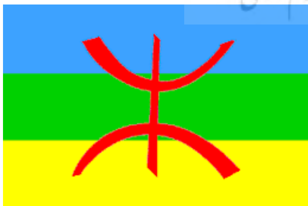
تصویر ۳. چهار رنگ اصلی آبی، سبز، زرد و قرمز بر روی پرچم آمازیغ‌ها.

درخصوص کاشی‌کاری حوض و آبخوری باید گفت طرح‌ها و رنگ‌ها تابع کاشی‌کاری سنتی مراکشی بوده که به «زلیج» معروف است و ریشه در هویت اسلامی مراکش دارد. البته باید توجه داشت که موزاییک‌کاری رومنی هنری شناخته شده در مراکش بوده و شباهت طیف رنگی موزاییک‌کاری رومنی و کاشی زلیج – سبز، آبی، مشکی، سفید، خرمایی یا اخراپی – می‌تواند خاستگاه رومنی آن را تقویت می‌کند. اما به نظر می‌رسد تفاوت بارز در جایابی آنهاست؛ در هنر رومن‌ها موزاییک‌ها، که خود ریشه در سنت یونانی دارد، برای مفروش کردن کف استفاده می‌شود (برای اطلاع بیشتر نک. گاردنر، ۱۳۸۴) اما کاشی‌های زلیج همچون کاشی‌کاری‌های اسلامی مناطق دیگر علاوه بر کف، بیشتر دیوار و جداره‌ها را پوشش می‌دهند.