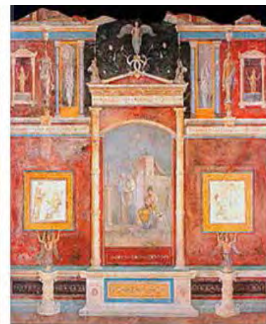
تصویر ۷. اهمیت قاب در هنر رومن.