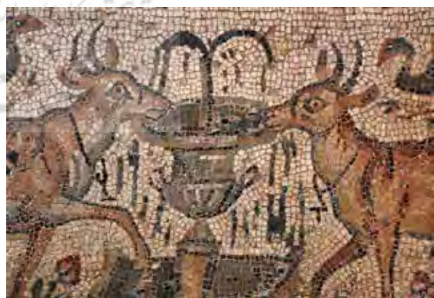
تصویر ۶: چشمه زندگی در فرم گل‌دان. آثار هنری رومن. مأخذ: