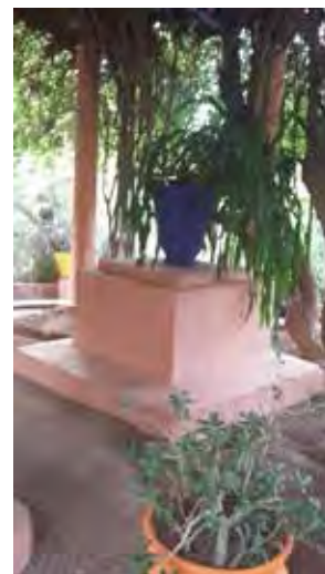
تصویر ۴. گلدان‌های رنگین درختان با بهره‌گیری از رنگ‌های آمازیغ‌ها. باغ‌ماژورل. عکس: پدیده عادلوند، ۱۳۹۵.

به شمار می‌روند که در طول تاریخ پذیرای فرهنگ‌های مختلف چون یونانی، رومنی، بیزانسی و اسلامی بوده‌اند. شاید بتوان گفت بیشترین تأثیر را بر فرهنگ مراکش رومن‌ها و مسلمانان داشته‌اند و فرهنگ رومنی - اسلامی را شکل داده‌اند. به نظر می‌رسد نشانه‌ها و ظواهر فرهنگ رومنی با ظهور اسلام همچنان تداوم یافتند به‌ویژه در خصوص تزئینات که تأثیرات رومن‌ها در نقش‌ها و رنگ‌ها کاملاً مشهود است. رنگ‌های زرد اخراپی، سفید، سیاه، سبز و قرمز رنگ‌های رایج در نقاشی دیواری و موزاییک‌های رومن‌ها است که محققان بسیاری چون «هلن گاردنر» در کتاب «هنر در گذر زمان» به آن‌ها اشاره کرده‌اند و امروز در کاشیکاری‌های مراکشی معروف به «زلیج» شاهد آن هستیم.