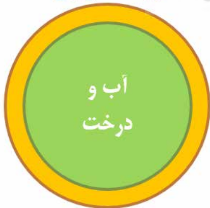
متن: آب و درخت حاشیه: گلدان