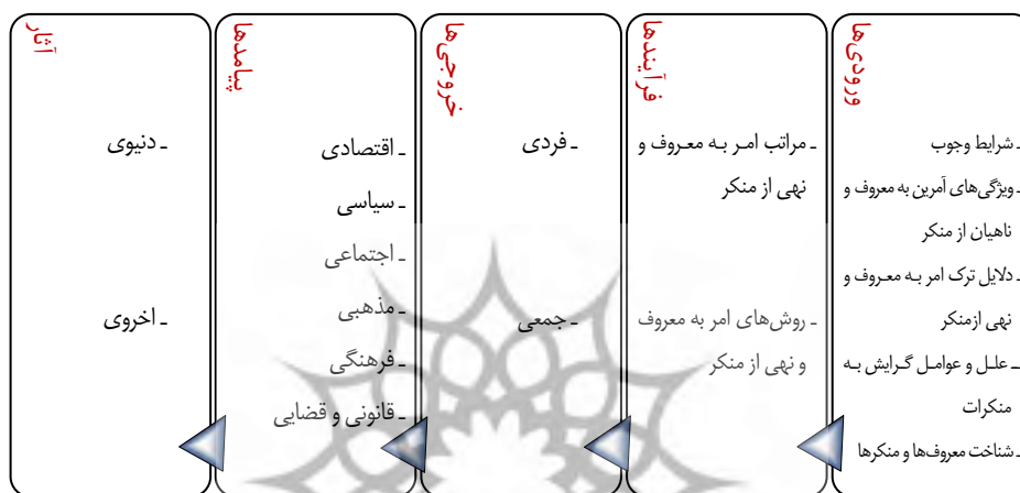
شکل ۳: مدل پیشنهادی پژوهش

بر اساس گام‌هایی که پیش از این توضیح داده شد، مدل اجتماعی امر به معروف و نهی از منکر مبتنی بر مدیریت زنجیره نتایج حاصل شد که می‌توان اجزای اصلی آن را در شکل شماره ۳ مشاهده نمود.