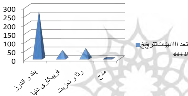
تعداد ابیات تکراری بیهقی

در نمودار زیر تعداد ابیات تکرار شده در تاریخ بیهقی و نیز موضوعات مربوط به آنان مورد ارزیابی آماری قرار گرفته است.