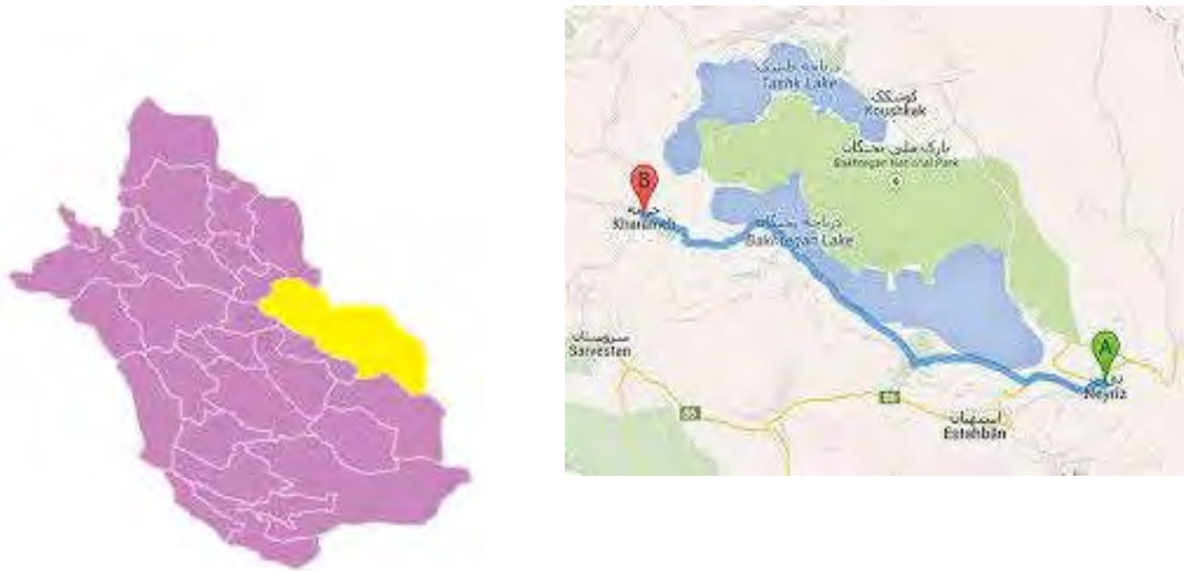
شکل ۱- موقعیت جغرافیایی منطقه نی ریز (پورتال جغرافیایی ایرانیان).