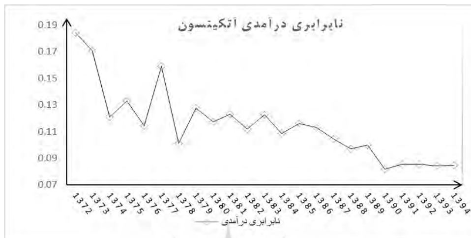
شکل ۲- نابرابری درآمدی

آزادسازی قیمت‌ها در کوتاه مدت باعث کاهش نابرابری درآمدی در بین خانوارهای شهری ایران شده، اما در بلندمدت نه تنها هدف کاهش نابرابری را تأمین نکرده، بلکه به افزایش نابرابری نیز دامن زده است.