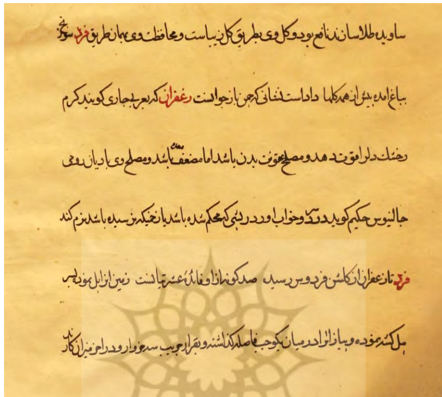
شکل ۲- شروع مبحث زعفران در نسخه خطی ارشادالزراعه

مؤلف در ارتباط با زراعت، کاشت زعفران و کود دهی به‌طور دقیق وارد جزئیات می‌شود: