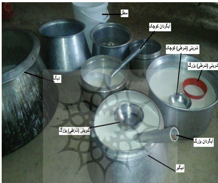
شکل ۳- ظروف پیمایش شیر در نظام دون، منبع: یافته‌های پژوهش، ۱۳۹۶

بزرگ است که معادل دو شربتی کوچک گنجایش دارد و کوچک‌ترین ظرف پیمایش، شربتی (شرطی) کوچک است (شکل شماره ۳).