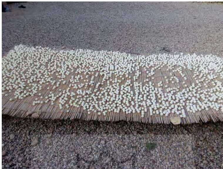
شکل ۴- خشک کردن کشک بر روی چق