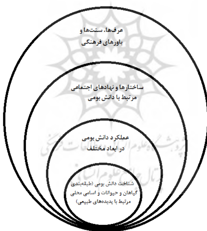
شکل ۲- سطوح تحلیل در تحلیل بدنه دانش بومی (Kalland, 1994)

شناخت دانش، عملکرد، ساختار اجتماعی، باورها و سنت‌هاست (شکل ۲)، که با شناخت دانش تجربی آغاز شده و در سطح دوم تأکید بر عملکرد دانش بومی دارد. در سومین سطح ساختار اجتماعی مرتبط با دانش بومی مورد توجه قرار می‌گیرد و در بالاترین سطح تحلیل، تمرکز بر شکل‌گیری یک درک منطقی و ادراک زیست‌محیطی است که می‌تواند باورهای بومی، عقاید و سنت‌های محلی را در برگیرد. باید توجه داشت که این چارچوب می‌تواند در تحلیل دانش بومی مؤثر واقع شود و بر اساس آن مؤلفه‌های مختلف دانش بومی قابل بررسی و تحلیل هستند.