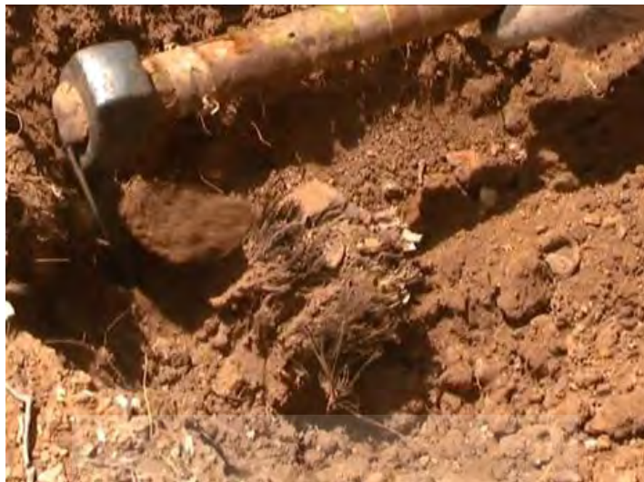
عکس ۱۱. مرحله کُشتن و حفر گودال

واکاوی دانش بومی پیرامون گیاه گنبو (آنگوزه) ... ۳۹