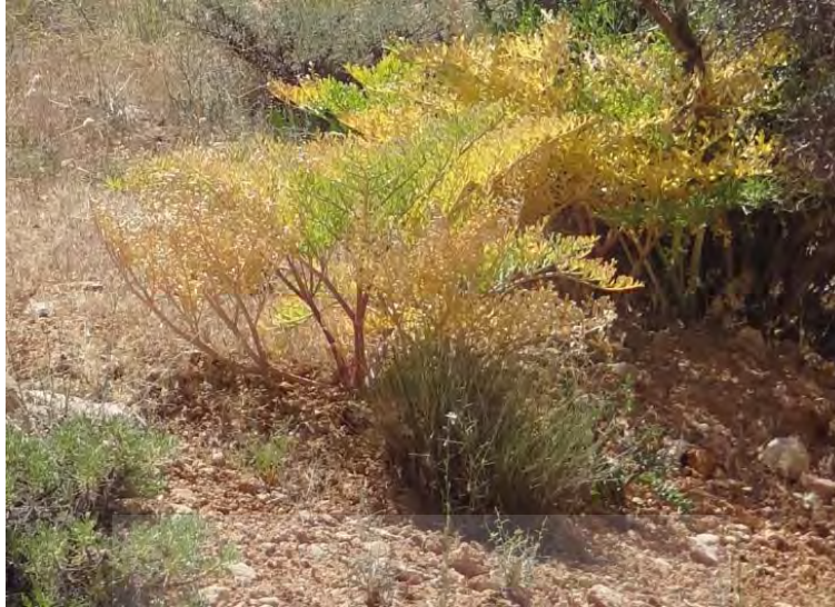
عکس ۹. گیاه قابل بهره‌برداری که رنگ آن رَش است