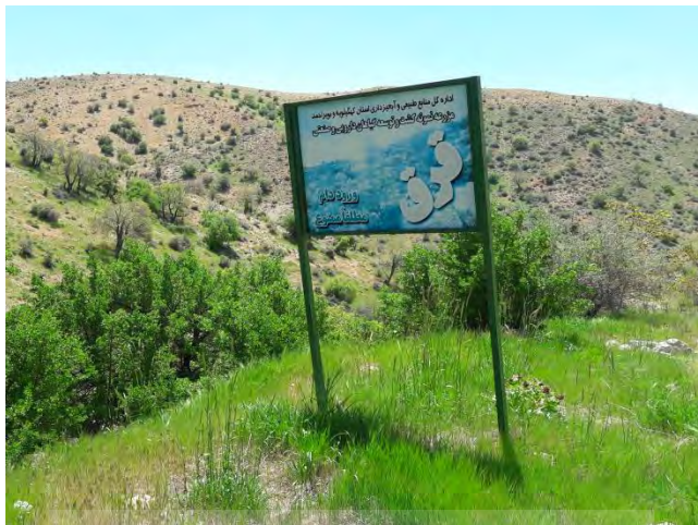
عکس ۳. قرق مراتع جهت توسعه گیاه گنبو