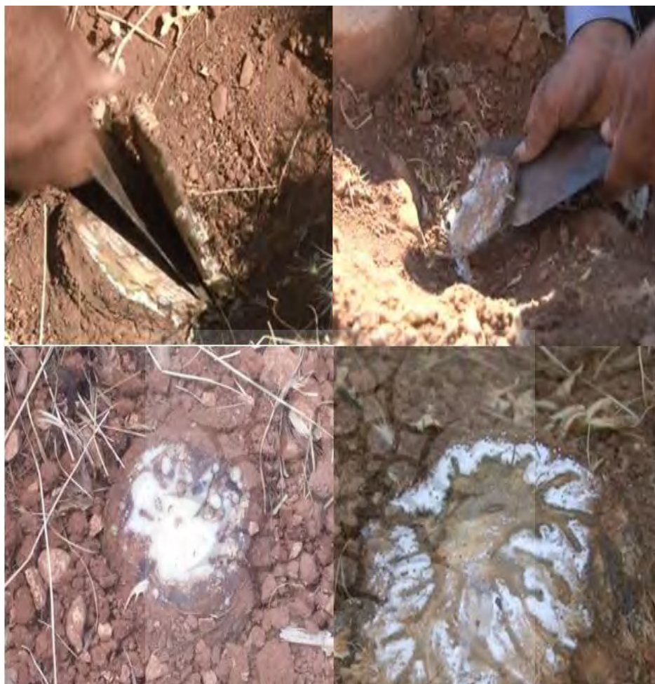
عکس ۱۳. برش زدن گیاه بوسیله کارد و تراوش شیر و جمع شدن بر روی کُنده