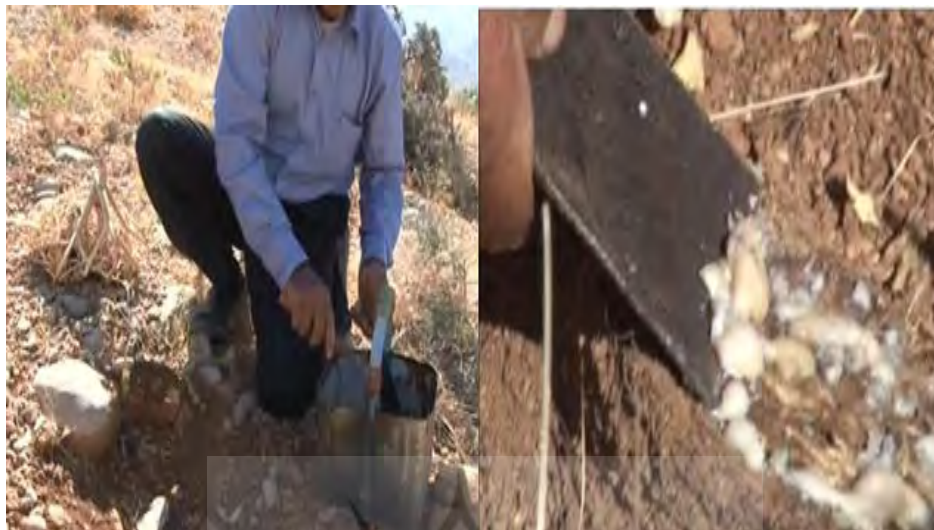
عکس ۱۴. جمع‌آوری شیر خارج شده و ریختن آن در ظرف مخصوص