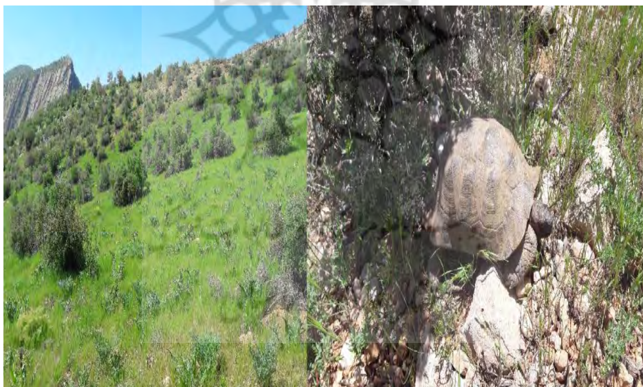
عکس ۸. افزایش تراکم پوشش گیاهی منطقه در اثر قرق جهت گسترش گیاه گنبو