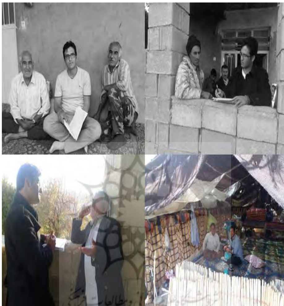
عکس ۴. حضور محقق میدانی (نویسنده مسئول) در منطقه و مصاحبه با مردم محلی