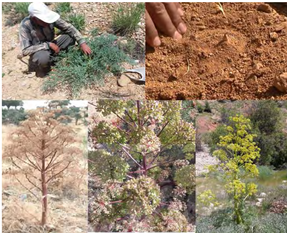
عکس ۵. مراحل مختلف رویشی گیاه