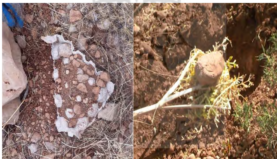
عکس ۱۵. سمت راست؛ استفاده از شاخ و برگ گیاه برای سایبان جهت حفظ ریشه و شیر استحصالی. سمت چپ؛ استفاده از شانه تخم‌مرغ برای سایبان پایه‌هایی که شاخ و برگ گیاه بوسیله باد یا عامل دیگری از بین رفته است