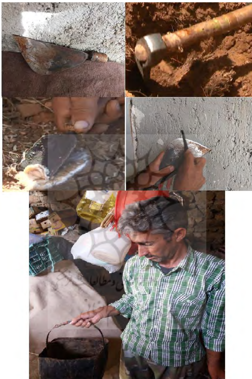
عکس ۱۶. ابزار کار مورد استفاده در بهره‌برداری گنبدو