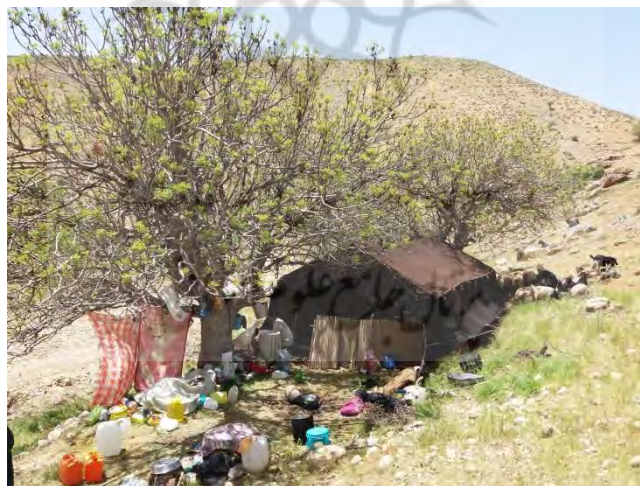
عکس ۲. پُھون (سیاه چادر) دامدار و بهره‌بردار گنبو از طایفه آقائی