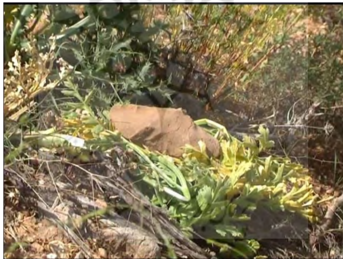
عکس ۱۰. مرحله پیچاندن و خواباندن اندام هوایی بر سطح زمین و گذاشتن سنگ بر روی آن