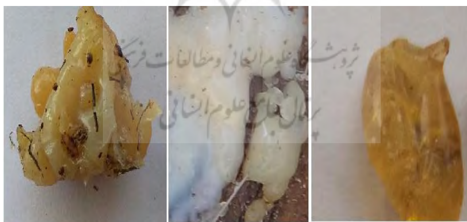
عکس ۶. انواع شیره گنبو؛ به ترتیب از راست به چپ آشکی، گُخ و گنده