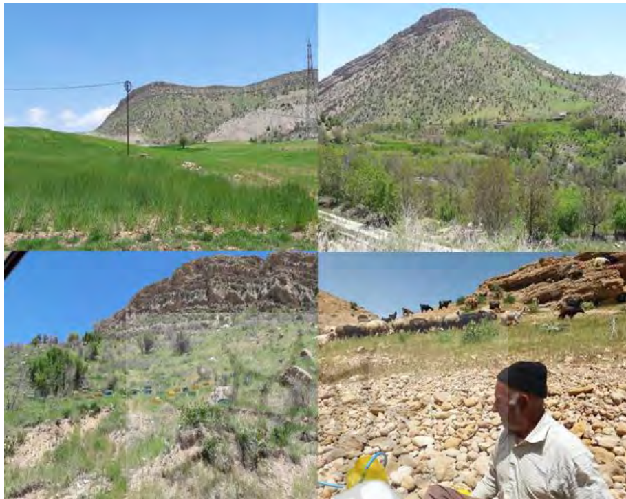
شکل ۱. فعالیت‌های (باغداری، زراعت، دامداری و زنبورداری) مردم تنگ‌سرخ