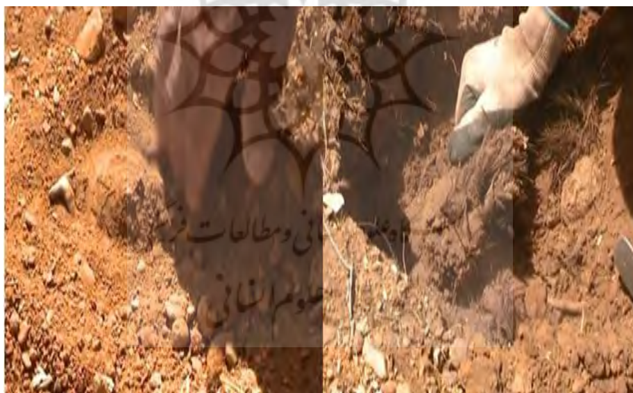
عکس ۱۲. تمیز کردن سطح کُنده گیاه و آماده سازی برای برش زدن