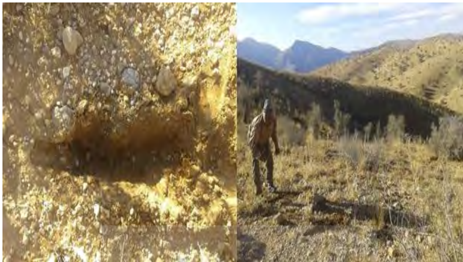
عکس ۷. کاشت گنبو به صورت بذرپاشی و کپه‌کاری

واکای دانش بومی پیرامون گیاه گنبو (آنغوزه) ... ۳۷