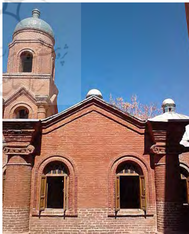
تصویر ۲: برج ناقوس کلیسای قزوین.

از جمله کارکردهای برج می‌توان به کارکردهایی چون کبوترخانه‌ها مانند برج «آقا» در استان اصفهان (سازمان میراث فرهنگی و گردشگری، ۱۳۸۵ الف)، آبیاری (حفظ فشار