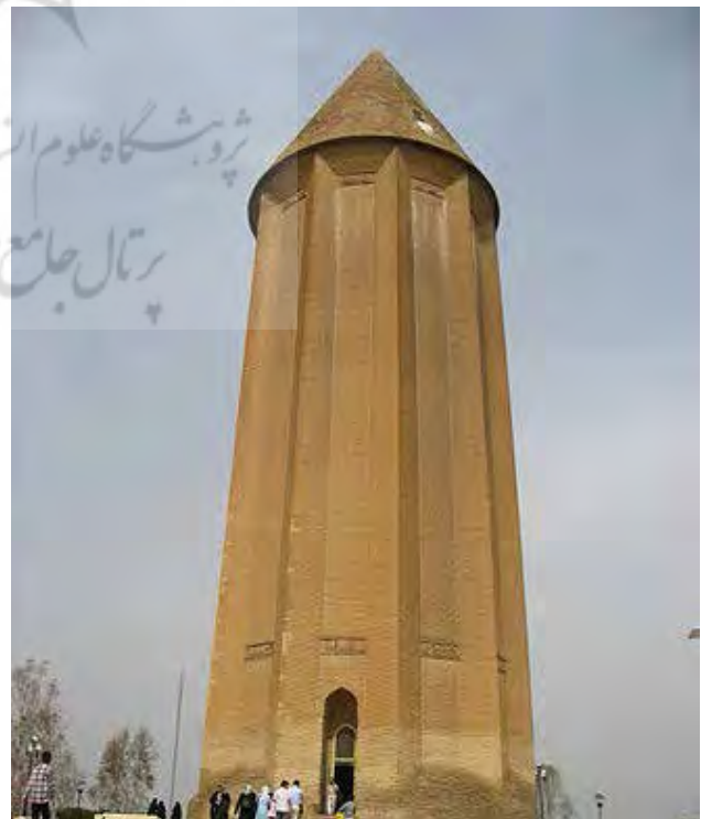
تصویر ۴: برج قابوس بن وشمگیر.