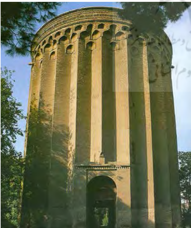
تصویر ۵: برج طغرل.

برج آرامگاه طغرل در شرق آرامگاه ابن‌بابویه در شهری واقع شده است که از آثار برج‌های مانده از دوره سلجوقیان است. این برج بدون احتساب گنبد مخروطی شکل که امروز اثری از آن باقی نمانده است، حدود بیست متر ارتفاع دارد. وجه تسمیه این برج به طغرل بیک یکم بازمی‌گردد.