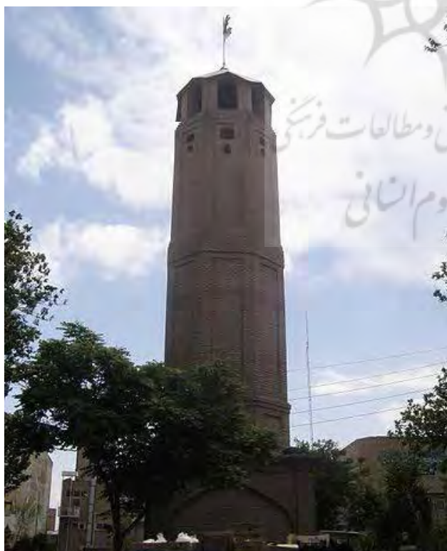
تصویر ۳: برج آتش‌نشان تبریز.

آب) مانند برج «آب» بانک ملی (سازمان میراث فرهنگی و گردشگری، ۱۳۷۵)، سرداب «برج آرامگاهی شاهزاده حسین» (سازمان میراث فرهنگی و گردشگری، ۱۳۸۰ الف) و برج‌هایی که به منظور خاصی مثلاً اهدای خلعت به افراد خاص احداث شده بودند، مانند برج «خلعت‌پوشان» در استان آذربایجان شرقی (سازمان میراث فرهنگی و گردشگری، ۱۳۷۷ ب) اشاره کرد. گروه دیگری از برج‌ها، کارکرد سنجش زمان را داشته‌اند؛ چه از نظر نشان‌دادن ساعات روز، چه ماه و سال، مانند «برج ساعت» در استان گیلان (سازمان میراث فرهنگی و گردشگری، ۱۳۵۶). گروه دیگری از برج‌ها در علم نجوم کاربرد داشته‌اند؛ هم در ستاره‌شناسی و هم رصدخانه، مانند «برج طغرل» در شهر ری (سازمان میراث فرهنگی و گردشگری، ۱۳۱۰). گروه دیگر برج‌های اقامتگاهی بوده‌اند که یا کاروان‌سرا بودند مانند برج «چاه‌خور» (سازمان میراث فرهنگی و گردشگری، ۱۳۸۵ ب) یا قلعه، مانند «برج امان‌الله» در استان کرمان (سازمان میراث فرهنگی و گردشگری، ۱۳۸۴ ج) یا کاملاً مسکونی بوده‌اند، مانند برج «بمونی آقا» در استان خوزستان (سازمان میراث فرهنگی و گردشگری، ۱۳۸۴ هـ). دسته آخر این برج‌ها کوره‌ها بوده‌اند، مانند برج «شوشتری» در استان فارس (سازمان میراث فرهنگی و گردشگری، ۱۳۸۶).