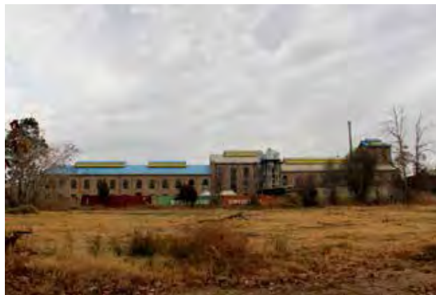
تصویر ۱: کارخانه تصفیه‌خانه قند ورامین. عکس: امیرعلی قنبری، ۱۳۹۵.