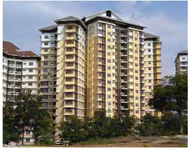
تصویر ۱: بناهای انتخاب شده برای انجام مطالعه. عکس: فاطمه خزاعی، ۱۳۹۵.