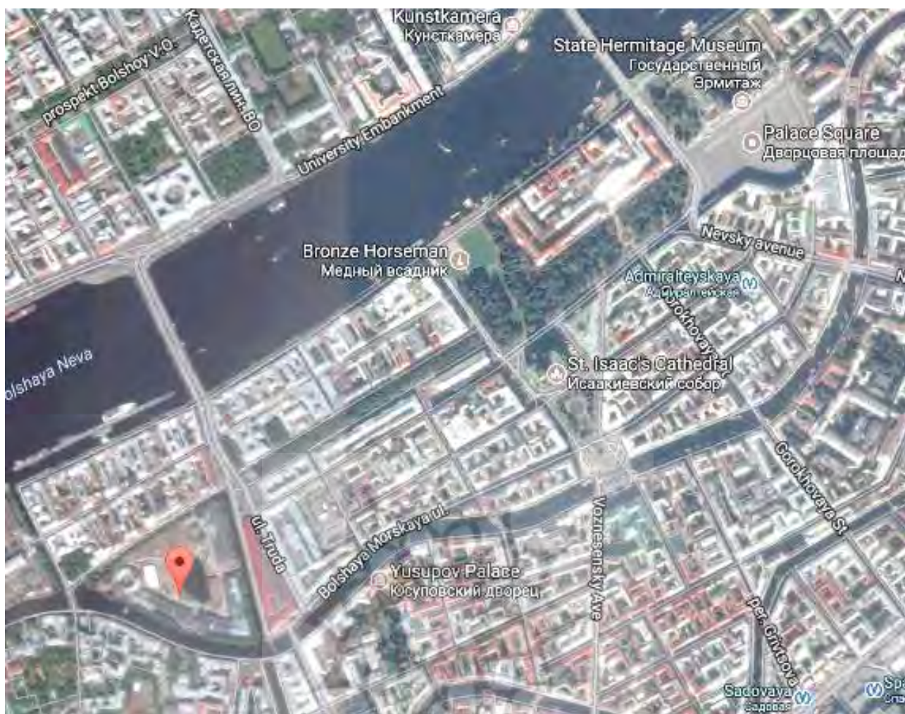
تصویر ۱: نقشه مرکز شهر و مکان جزیره نیو هلند، سن پترزبورگ، روسیه.

پژوهشگاه علوم انسانی و مطالعات فرهنگی پرتال جامع علوم انسانی