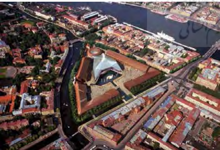
تصویر ۵: طرح شرکت فاستر و شرکا، سن پترزبورگ، روسیه. مأخذ: http://www.fosterandpartners.com/projects/new-holland-island

این مجموعه به همین ترتیب تا قرن معاصر باقی ماند و پس از تعطیلی زندان متروک شده و در نهایت در سال ۲۰۰۴ مالکیت آن از نیروی دریایی به شهر واگذار شد. در سال ۲۰۰۶ رقابتی به منظور بازسازی این جزیره برگزار شد که نهایتاً شرکت نورمن فاستر و شرکا ۳ برنده این رقابت شدند. طرح مذکور پیشنهاد ساخت یک مجتمع چند منظوره بود که بنا به دلایل مختلف از قبیل تغییر مدیریت شهری هرگز اجرا نشد (تصویر ۵). برای بار دوم در ژانویه ۲۰۱۱ فراخوان یک رقابت جدید با عنوان «ایده‌های جدید برای نیو هلند» رونمایی شد. در تعریف این شعار می‌توان به طراحی یک مرکز چندعملکردی فرهنگی و اجتماعی اشاره کرد. در این رقابت شرکت‌های مطرح از سرتاسر جهان شرکت کردند و در