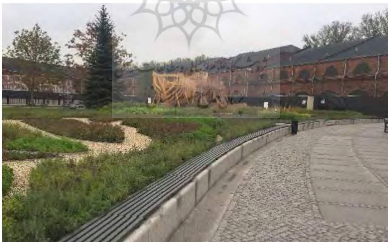
تصاویر ۸ و ۹: طراحی در مقیاس خرد با ساخت کشتی و باغچه گیاهان دارویی، سن پترزبورگ، روسیه. عکس: کیوان کیانی، ۱۳۹۵.