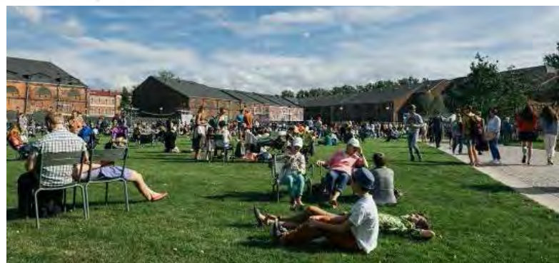
تصاویر ۲ و ۳: برگزاری مراسم و فعالیت‌های اجتماعی در جزیره نیو هلند، سن پترزبورگ، روسیه. مأخذ: http://www.west8.nl/projects/new_holland