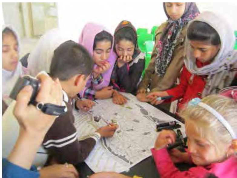
تصویر ۴: شناخت محله و ترسیم جزئیات در نقشه توسط کودکان، محله هرنندی، تهران.

طرح شهر دوست‌دار کودک بم شامل پروژه‌های متعددی بود که به لحاظ عملکردی و زیرساختی نیازهای کودکان را تأمین می‌کرد. این پروژه‌ها شامل احداث زمین بازی، ایجاد تجهیزات بهداشتی، تأمین آب نوشیدنی سالم، تجهیز امکانات بهداشتی مدارس، ساخت مدرسه، احداث مرکز نگهداری کودکان خردسال بوده است. در این پروژه‌ها که در فرایند مشارکتی برنامه‌ریزی و طراحی شده است، مانند پروژه مدرسه رویایی؛ طراحان پس دریافت نظر کودکان اولویت‌بندی آنها نسبت به موضوعات و پیشنهادات را با اولویت‌هایی که گروه طراحان در نظر گرفته بودند مقایسه