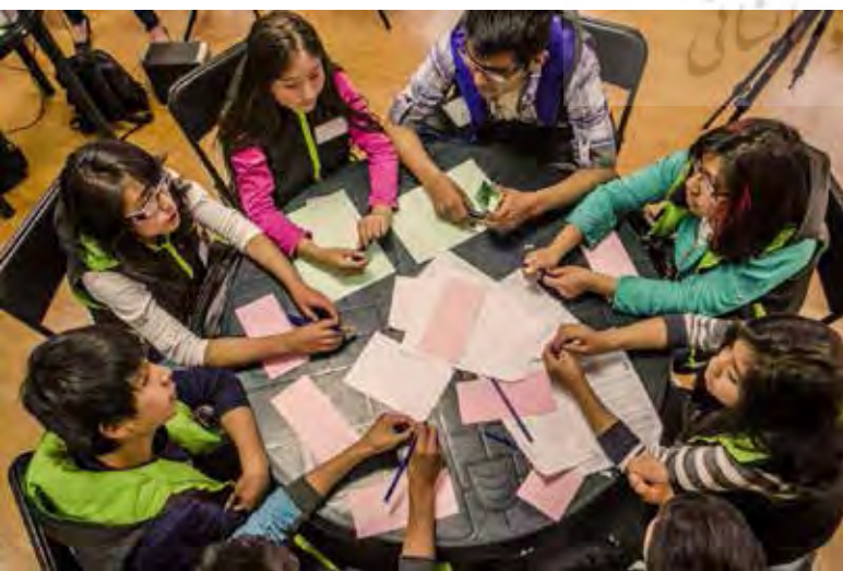
تصویر ۲: گروه آبی کودکان و تبادل اطلاعات، مأخذ:

http://www.ecpat.org/wp-content/uploads/2016/05/Children_at_table-1024x678.jpg