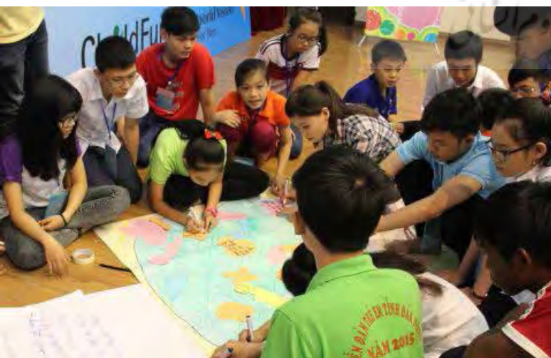
تصویر ۱: گروهی از کودکان و ترسیم جزئیات در نقشه، مأخذ: http://www.wvi.org/sites/default/files/styles/large/public

ارایه نظریه‌های سرمایه‌های اجتماعی در شهر از سوی