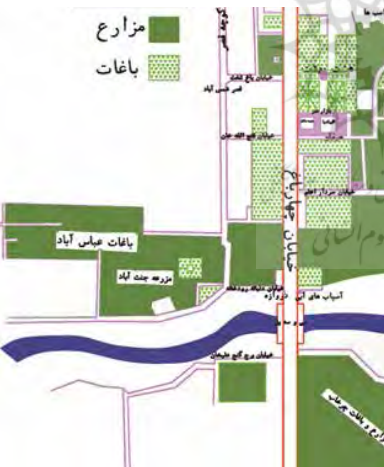
تصویر ۷: باغ و مزارع موجود در اطراف خیابان چهارباغ عباسی روی نقشه سید رضاخان به کوشش شفقی (۱۳۰۲ ه.ش).

- باغ تخت در سمت مغرب چهارباغ و به مساحت ۴۰ هزار ذرع. این باغ دو قصر داشت، یکی رو به چهارباغ و دیگری رو به خیابان فرعی محل شمس آباد که امروزه خیابان شیخ بهایی نامیده می شود.