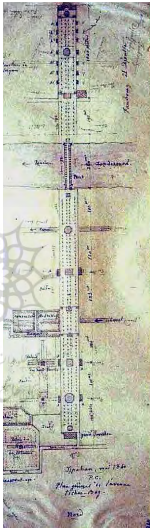
تصویر ۴: ترتیب حوض‌های چهارباغ براساس نقشه پاسکال کست.

باغ‌ها و کاخ‌های خیابان چهارباغ عباسی در دو جبهه شرقی و غربی این خیابان قرار گرفته‌اند. جبهه شرقی این خیابان شامل باغ خرگاه، باغ بلبل،