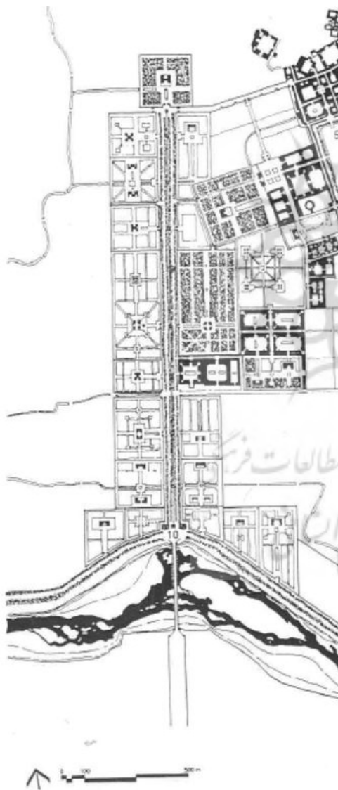
تصویر ۶: نقشه ترسیمی از چهارباغ اصفهان از دونالد ویلبر.

مدرسه چهارباغ، باغ توت، مهمان‌خانه درویشان نعمت‌اللهی و شیرخانه بوده است. جبهه غربی این خیابان شامل باغ هشت‌گوش، تخت، مو، مهمان‌خانه درویشان حیدری و قفس‌خانه بوده است (تصویر ۶). با توجه به این ترسیم، تمامی بدنه این خیابان به غیر از مدرسه چهارباغ، باغ بوده است. مدرسه چهارباغ اصفهان در زمان شاه سلطان‌حسین در این خیابان ساخته شده است. در این نقشه، باغچه‌بندی‌های