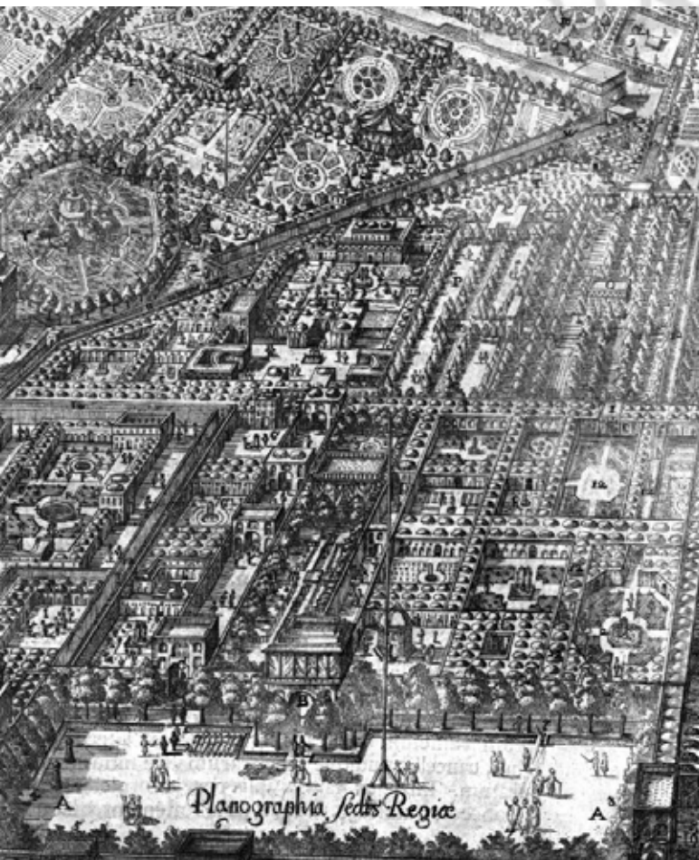
تصویر ۱: دورنمایی از دولت‌خانه اصفهان از کمپفر.

خط ارتباط دهنده مایل دروازه‌دولت و باغ گلدسته (هشت‌ضلعی) که گذری را مشخص می‌کند، به احتمال زیاد، حد جنوب غربی حصار بویه‌ای قرن چهارم است و فاصله میدان نقش جهان و حصار