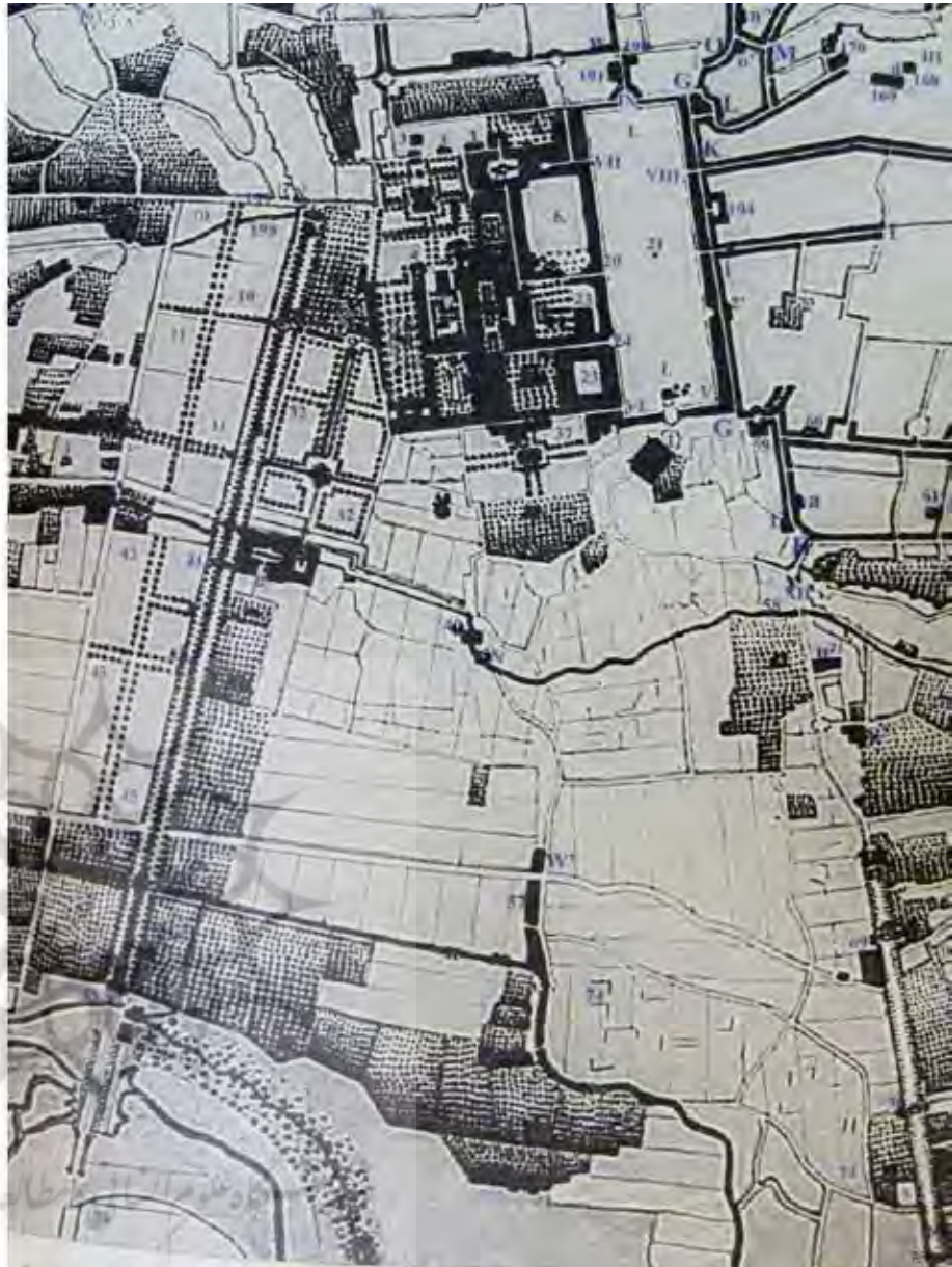
تصویر ۳: نقشه اصفهان توسط نقشه‌برداران روسی. مأخذ: هولستر، ۱۳۵۵.

شده و طرح کلی آن با نقشه‌های فعلی فرق ناچیزی دارد. شبکه‌های ارتباطی، خیابان‌ها و گذرهای اصلی و بالاخره ادارات دولتی و بناهای مهم شهر، در محل واقعی خود ترسیم شده است. از جمله اشتباهات این نقشه، هم جهت بودن میدان نقش جهان و دولتخانه با خیابان چهارباغ عباسی است (تصاویر ۴ و ۵). در تصویر ۴، کست به جایگاه حوض‌های خیابان چهارباغ پرداخته است. وی تعداد حوض‌ها را هشت