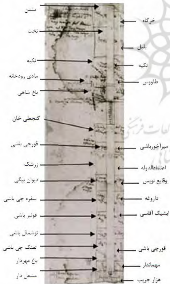
تصویر ۲. پلان خیابان چهارباغ، ترسیم از انگلبرت کمپفر.

این حوض مربع‌شکل و کوچک بوده (شاردن، ۱۳۷۵: ۱۲۰)، به طوری که یکی از سیاحان در شمارش تعداد حوض‌ها، این حوض را به همراه دو حوض دیگر، در مقایسه با حوض‌های بزرگ دیگر به حساب نیاورده است. فرضیه صحت این ترسیم، تغییر ساختاری این حوض در این دوره است. همچنین در این نقشه، باغچه‌بندی شعاعی در باغ‌های بلبل و خرگاه که در ترسیم کمپفر دیده شده، وجود ندارد. در این نقشه نیز همانند ترسیم کمپفر ابتدا و انتهای باغ‌ها در دو جبهه شرقی و غربی خیابان در یک امتداد است. از موارد دیگر می‌توان به محل مادی‌های این خیابان و تعداد چهار ردیف درخت اشاره کرد.