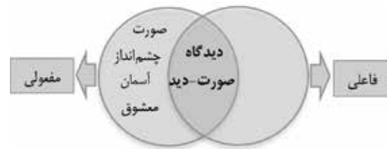
تصویر ۲. طبقه‌بندی مفاهیم منظر در شعر فارسی قرن ۳ تا ۷ هجری بر حسب وجه فاعلی یا مفعولی آنها. مأخذ: نگارندگان، ۱۳۹۶.

بررسی این پژوهش انتخاب شد و کاربرد آن تدریجاً فزونی گرفت. چشم‌انداز، منظر است از طبیعت معمولاً گزیده که در برابر ناظر قرار دارد. اشاره به منظر مقابل ایوان، که منظر مصنوع است، بیان‌کننده مفهومی مفعولی و مربوط به دنیای ظاهر است که در کنار صورت بر مصداق دیگری از منظر به مثابه بیرون دلالت می‌کند. دو مفهوم منظر تا این مرحله بر وجه یک معنایی استوارند (تصویر ۴).