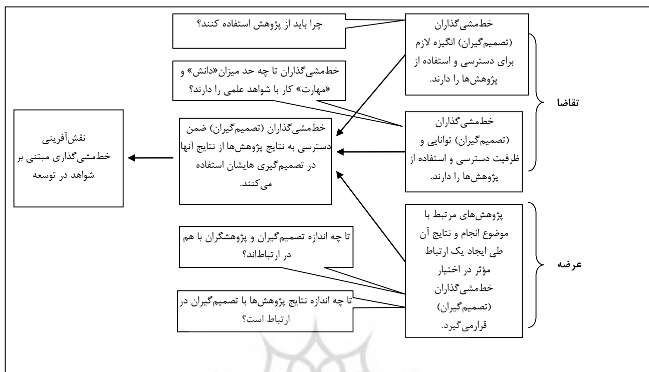
تصویر ۲. مدل عرضه و تقاضا؛ مأخذ: Newman, Capillo, Famurewa, Nath, & Siyanbola, 2013: 2.

با معاونت تخصصی متناظر در شهرداری تهران همکاری می‌کنند، با هدایت و راهبری مرکز مطالعات و برنامه‌ریزی شهر تهران مشخص می‌شوند (شهرداری تهران، ۱۳۸۸: ۶). پس از این اتفاق، اگرچه بخش‌ها و سازمان‌های مختلف در شهرداری تهران در قالب تفسیرهایی از تبصره‌های بودجه سالیانه اقدام به تعریف و هزینه‌کرد در فعالیت‌ها و اقدامات مطالعاتی و پژوهشی کرده‌اند، اما سازوکار رسمی تعریف و اجرای پژوهش‌های شهری در قالب نظام‌نامه پژوهشی شهرداری تهران، با راهبری مرکز مطالعات و برنامه‌ریزی شهر تهران انجام می‌پذیرد.