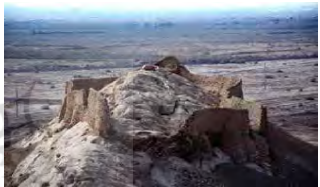
تصویر ۵. بقایای دخمه قدیمی؛ دید از دخمه مانکجی. شهر کرمان در جنوب و در پس زمینه عکس دیده می‌شود.

و در کنار دخمه قدیمی کرمان قرار گرفته است (تصاویر ۱، ۲ و ۵).