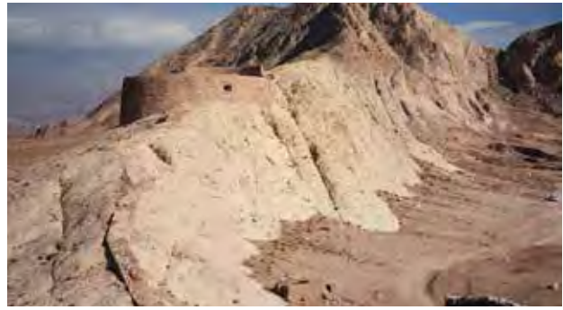
تصویر ۴. دخمه مانکجی؛ اتاق دخمه بان در گوشه پایین سمت راست دیده می‌شود.

فهم این دارایی ملی و دانستن تاریخ و معنای آن، گامی اساسی در جهت اقدام برای چگونگی حفاظت این اثر تاریخی است. در تشخیص میزان اهمیت حفاظت بنا مؤلفه‌های متعددی از جمله : تصویر جایگاه فرهنگی، اجتماعی،