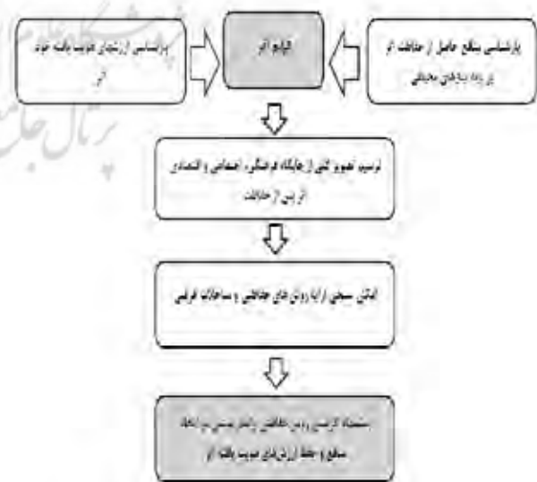
تصویر ۶. روند گزینش روش حفاظتی پایدار در دخمه زرتشتیان کرمان.

اگر فرآیند حفاظت یک اثر تاریخی را آن هنگام که اثر مورد توجه خاص برای حامیان میراث فرهنگی قرار می‌گیرد به عنوان فعالیتی زمان‌بر، دشوار و پیچیده در نظر بگیریم،