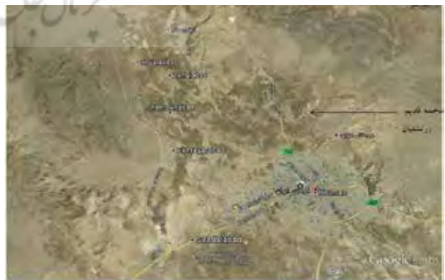
تصویر ۱. موقعیت دخمه زرتشتیان نسبت به شهر کرمان.

پس از ورود اسلام، با وجود محدودیت‌ها، زرتشتیان بخش‌های زیادی از آیین‌های خود را نگاه داشتند و اگرچه اجزای رسوم آیینی آنها احتمالاً دچار تغییراتی شد، بنیان و شالوده آنها همواره ثابت باقی ماند (مزداپور، ۱۳۸۳: ۱۴۷). به تدریج زرتشتیان فارس و خراسان به سیستان و مکران رفته