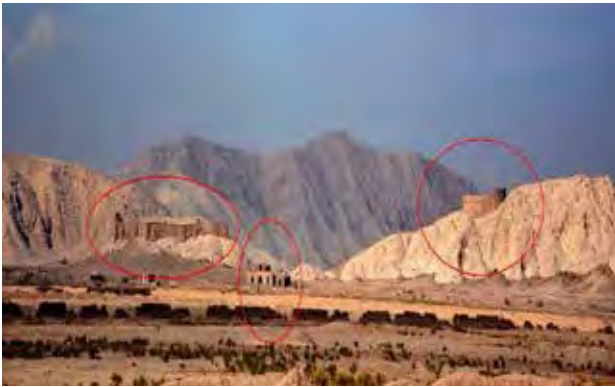
تصویر ۲. دخمه مانکجی لیمجی (سمت راست). دخمه ساسانی (سمت چپ) و ساختمان مراسم (مرکز).