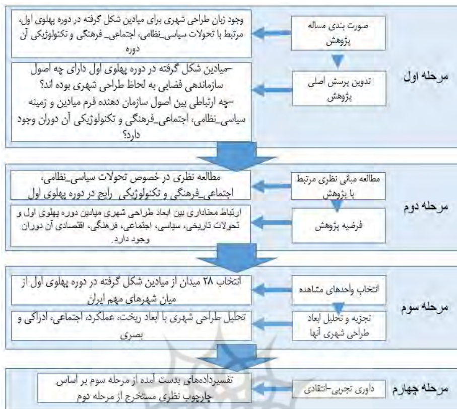
تصویر ۲. نمودار فرآیند انجام پژوهش و مراحل آن.

انجام آن چهار مرحله اصلی را شامل می‌شود: مرحله (۱): صورت‌بندی مسئله پژوهش؛ مرحله (۲): تدوین چارچوب نظری پژوهش؛ مرحله (۳): مرحله عملیاتی کردن؛ مرحله (۴): داوری تجربی-انتقادی، است. جزییات مرتبط با ماهیت مسئله در نمودار (تصویر ۲) بسط داده شده است. به طور کلی در تدوین چارچوب نظری پژوهش به تحولات رخ داده در زمینه‌های نوسازی شهری، تحولات سبک زندگی، اقتصادی، اجتماعی، فرهنگی، تکنولوژیکی پرداخته شده است و داوری تجربی-انتقادی تفسیر این تحولات و بسط آنها در ارتباط با ابعاد طراحی شهری کرمونا (بعد ریخت، بعد بصری، بعد اجتماعی، بعد ادراکی و بعد عملکردی) در خصوص با میادین منتخب صورت گرفته است.