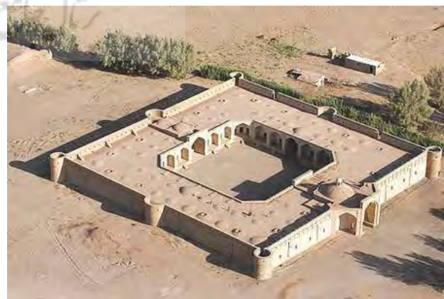
تصویر ۱. حیاط (کاروانسرای مرنجاب) به مثابه یک جایگاه مادی.