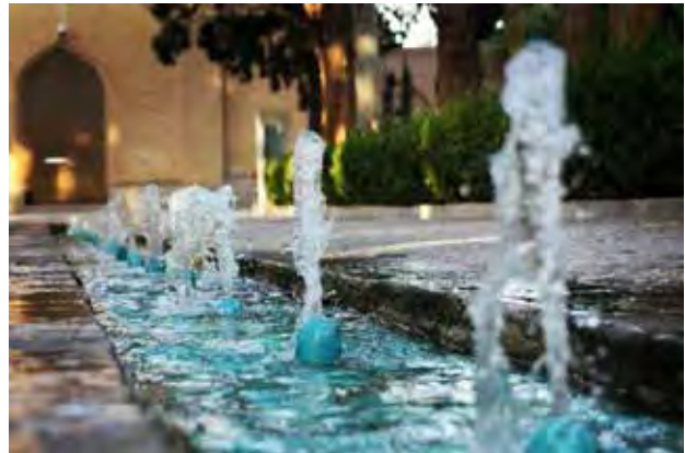
تصویر ۳. حیاط (باغ فین) در پرتو نمادپردازی‌های متعدد به مثابه سکونتگاهی الهی و معنوی.

محدوده یا جایگاه مادی کمک می‌کنند. این جایگاه علاوه بر مرزهای فیزیکی، از طریق مرزهای نامرئی معین نظیر حریم و غیره که برگرفته از بینش اسلامی است، تقویت می‌شود. محدوده فضایی ایجادشده، در درون خود عناصر متعددی از جمله حوض آب، کفسازی‌ها، باغچه‌ها، گل‌ها، درختان، انسان و غیره را احاطه می‌کند. انسان با حضور در این حیاط از اتفاقات جاری در آن آگاهی می‌یابد. به عبارت دیگر آگاهی یافتن از امور حیاط نیازمند احاطه حسی (یعنی بصری، لامسه، ...) بر آن است. علاوه بر این حضور همین عناصر طبیعی به حیات حیاط کمک می‌کند. بسیاری از جنبه‌های طبیعی و مادی موجود در حیاط نمادها یا نشانه‌هایی معنوی را در خود به نمایش می‌گذارند؛ به‌گونه‌ای که شمایی از سکونتگاه جاویدان بهشتی را برای انسان متذکر می‌شود. مقایسه تعاریف ارائه‌شده از محیط و حیاط که از زبان، بینش و معماری اسلامی حاصل شده است، چند نکته در خود دارد: نخست آنکه دلالت‌های معنایی محیط در زبان فارسی و بینش اسلامی قرابت نزدیکی دارند. از سوی دیگر دلالت‌های معنایی حیاط در زبان فارسی، بینش اسلامی و معماری ایرانی‌اسلامی قرابت نزدیکی دارند. علاوه بر این، مقایسه تعاریف فوق مؤید نزدیکی محیط و حیاط است.