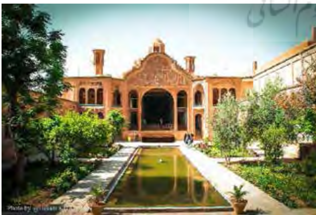
تصویر ۲. حیاط (خانه بروجردی‌ها) به مثابه یک قرارگاه زنده.

می‌شود. در این مرتبت، محیط حیاط نه تنها زنده است که ظرفی برای زندگی پدید آورده و به مثابه یک قرارگاه رفتاری عمل می‌کند (تصویر ۲)؛ (Rapoport, 2007: 58-64). فرهنگ ایرانی‌اسلامی برای این قرارگاه، بسته به رفتارهای انسانی حاکم بر آن اعم از سکونت و غیره، مرزهایی نامرئی قائل شده است ۴۸ تا مکمل مرزهای مادی مرتبت قبلی باشد. براساس آموزه‌های قرآنی، سکونتگاه نخستین و پایانی انسان بهشت است ۴۹ . درمقابل این سکونتگاه حقیقی، زندگی در زمین موقتی بوده و تنها یک قرارگاه یا مقر تلقی شده است ۵۰ . دل‌ن بستن به قرارگاه و آمادگی برای رسیدن به سکونتگاه اصیل و جاویدان نیاز به تذکرات نمادین بوده که در حیاط تجلی زیبایی می‌یابد. نظام چهاربخشی باغچه‌های حیاط گوشه‌ای از بهشت‌وارگی آنرا به نمایش می‌گذارد. انعکاس نماهای کالبدی در آب، بر رمز و رازهای عالم فرازمینی تأکید دارد. حضور شاعرانه باد در فضای حیاط و تصادم آن با عناصر طبیعی و زمینی، نمادپردازی‌های دیگری را نمایان می‌سازد. باد در کلام خدا مرتبتی بشارت‌دهنده و آگاهی‌بخش دارد ۵۱ . در ادبیات ایران نیز موقعیت‌های خبرده با استعانت از باد صبا تصویر شده است ۵۲ . در کلام خدا صعود از مرتبت خاک به سوی احدیت به واسطه دمیدن نفس رحمانی بوده که بر مضامینی همچون روحبخشی ۵۳ و فراخوانی ۵۴ تأکید دارد. تنها در پناه اتصال به این روح قدسی است که مصنوعات زمینی به مرتبتی بالاتر وارد می‌شوند ۵۵ . اتصال مستقیم زمین با آسمان در فضای حیاط، بر این مضامین صحنه گذاشته و آن را به شکل نمادین نمایان می‌سازد. بازی نور و سایه و تلاش در