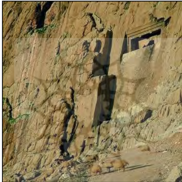
تصویر شماره ۶: گور دخمه، ماخذ: یآوری، ۱۳۹۰

کم و بیش انواع مختلف مقرنس بخصوص نمونه‌های ساده آن پیش از ظهور اسلام در ایران بکار رفته است و علاوه بر جنبه‌های ساختمانی جنبه تزیینی نیز داشته است و شاید بتوان نخستین نمونه‌هایی را که از دوران ماد بر جای مانده است نام برد که یکی از آن‌ها صخره‌ایی در نزدیکی سر پل ذهاب است که به نام دخمه داوود یا دکان داوود نامیده می‌شود که مقرنس از مایه اصلی بنا گرفته شده و از نوع مقرنس‌های جلو آمده است و دوم مقابر صخره‌ایی سکاوند واقع در جنوب بیستون است که به صورت سه جلو آمدگی در بالا و طرفین به صورت قابی سه نبش به چشم می‌آید. این نوع مقرنس نیز از نوع مقرنس‌های جلو آمده است. سومی هم مقبره‌ای است صخره‌ایی مشهور به داوود دختر در فارس که مشابه سکاوند است و در زیر قرنیز برجستگی ظریفی دیده می‌شود.