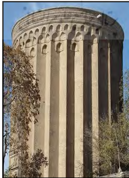
تصویر شماره ۹ : برج طغرل