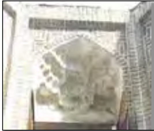
تصویر شماره ۳: مقرنس بازار تبریز، ماخذ: ابراهیمی؛ ۱۳۹۷

مقرنس‌های معلق: شبیه همان منشورهای آهکی آویزان در غارها یا استلاکتیت بوده و بیشتر از چسباندن مواد مختلف چون گچ، سفال، کاشی و مانند آن‌ها به سطوح مقعر داخل بنا شکل می‌گیرند. این نوع مقرنس آویزان به نظر می‌رسند و دارای ثبات کمی می‌باشند.