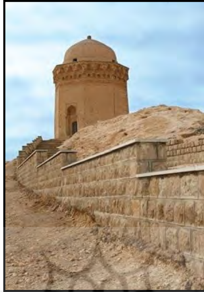
تصویر شماره ۸ : گنبد علی در ابرقو، ماخذ : نگارندگان

این یک مقبره برجی هشت ضلعی و دارای گنبد است که کلاً با سنگ ساخته شده و تاریخ (ثمان و اربعین و اربع مائه) در کتیبه بالای ساقه به چشم می‌خورد. این بنا دارای مقرنس زیبا و نسبتاً بدیعی است که بین انتهای ساقه و پایه گنبد در دو ردیف قرار دارد و مانند کمر بند بدور بنا می‌پیچد. اول یک ردیف سطوح گود بلافاصله در زیر پایه گنبد. دوم یک ردیف فرورفتگی‌های مستطیل در بالای کتیبه. سوم یک ردیف مقرنس سه قسمتی در بین دو ردیف مذکور