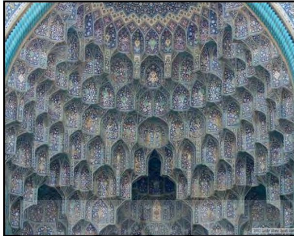
تصویر شماره ۱۰: مسجد جامع اصفهان

این مسجد یکی از بناهای مفصل و مهم است که تاریخ درازی دارد و مجموعه‌ای از عناصر و موضوعات مختلف معماری و تزیینی می‌باشد. مسجد جامع اصفهان در دوره سلجوقی دارای دو تالار مربع جنوبی و شمالی گردید و عنصر مورد بحث ما یعنی مقرنس در داخل همین دو تالار قرار دارد. تالار جنوبی مشهور به گنبد نظام الملک مورخ حدود ۴۸۰ و تالار شمالی مشهور به گنبد تاج الملک و مورخ ۴۸۱ هجری است. مقرنس‌های هر دو تالار در واقع همان منطقه تغییر حالت مربع به دایره پایه گنبد است و بنابراین ما برای تعقیب تحول این عنصر تزیینی از خارج بناها به داخل توجه می‌کنیم. گنبد نظام الملک - پلان این تالار مربع و به ضلع پلان این تالار مربع و به ضلع ۱۵ متر است و در طرف قبله به دیواری که محراب را در بر می‌گیرد محدود می‌گردد و از بناهای سه طرف دیگر خود بوسیله ستونهای - قوی که خود از ستون‌های گرد و به هم چسبیده تشکیل می‌شود مشخص است.