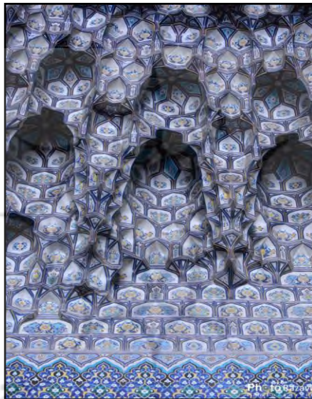
تصویر شماره ۴: مسجد گوهر شاد مشهد، ماخذ: نگارندگان؛ ۱۳۹۴

مقرنس‌های معلق: شبیه همان منشورهای آهکی آویزان در غارها یا استلاکتیت بوده و بیشتر از چسباندن مواد مختلف چون گچ، سفال، کاشی و مانند آن‌ها به سطوح مقعر داخل بنا شکل می‌گیرند. این نوع مقرنس آویزان به نظر می‌رسند و دارای ثبات کمی می‌باشند.