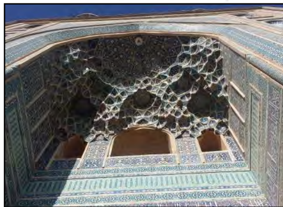
تصویر شماره ۵: مسجد جامع یزد

مقرنس‌های لانه زنبوری: چنانکه از نام آن پیداست، شبیه لانه زنبور هستند و در مجموع مانند کندوهای کوچک بر روی هم قرار گرفته دیده می‌شوند. این دسته از مقرنس‌ها تاحدی شبیه به مقرنس‌های معلق هستند.