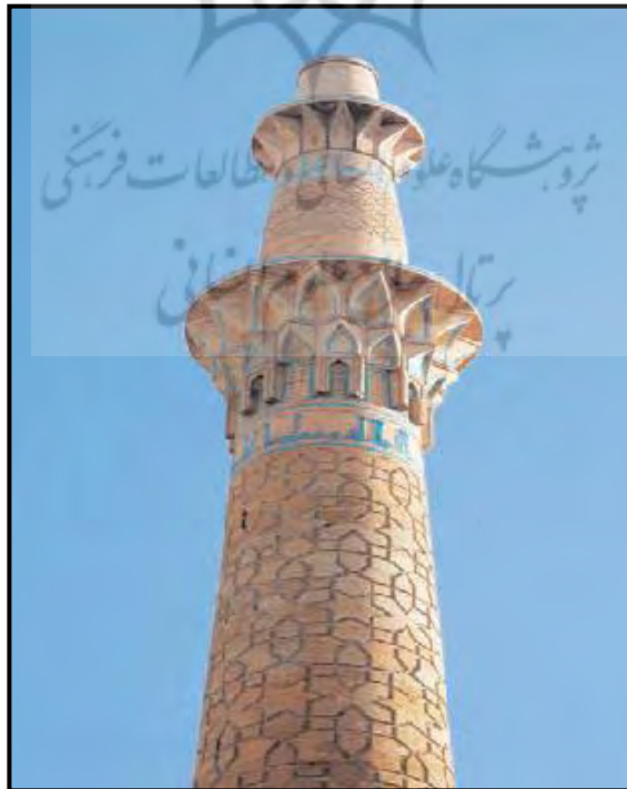
تصویر شماره ۱۱ : مقرنس کاری منار ساریان

این مناره که یکی از زیباترین مناره‌های عهد سلجوقی در اصفهان و در انتهای شمالی محله جوباره واقعه شده است (هنر فر، ۱۳۴۴ : ۱۹۹). در منار ساریان اصفهان نیز دو رشته مقرنس آجری دیده می‌شود. رشته اول در بالای کتیبه بزرگ مناره و در طرفین طاق نماهایی که بعضا دارای قوس شکسته هستند، قرار گرفته است. رشته دوم نیز به صورت مثلث‌های مقعری شکلی می‌باشد که در بالای طاق نماهای مذکور خود نمایی می‌کند. آنچه بر زیبایی مقرنس کاری منار افزوده است، آجرکاری‌های توام با کاشی فیروزه‌ای می‌باشد که چشم هر بیننده را بر جمال خود خیره می‌کند (حاتم، ۱۳۷۹ : ۶۹).