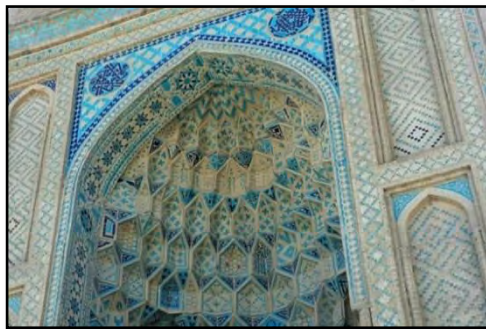
تصویر شماره ۲: مسجد جامع اشرجان، ماخذ: نگارندگان؛ ۱۳۹۵

مقرنس‌های جلو آمده: مقرنس‌هایی را می‌گویند که مصالح آن از خود بناست و در نهایت سادگی و بدون هیچ پیرایه‌ای به صورت آجر یا گچی، انتهای سطوح خارجی نمای بیرون ساختمان را آرایش می‌دهند و دارای ثبات متوسطی است.