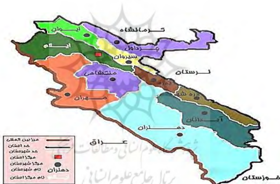
شکل شماره ۲: محدوده مورد مطالعه (شهرستان بدره) در استان ایلام

شهرستان بدره یکی از ده شهرستان استان ایلام است و مرکز آن شهر بدره است. بدره در ۳۸ کیلومتری غرب مرکز شهرستان بدره واقع شده است. حوزه جغرافیایی بدره با طول و عرض تقریبی ۷۰ در ۹ کیلومتری و با مساحت ۶۲۵ کیلومترمربع دارای طبیعتی کوهستانی و جنگلی است که حدود ۸۰ درصد منطقه، پوشیده از جنگل‌های انبوه بلوط است. بلندترین نقطه ارتفاعی در این شهرستان قله ورزرین با ارتفاع ۳۲۰۰ متری از سطح دریا است. فاصله تا مرکز استان ۷۰ کیلومتر است. جاذبه‌های تاریخی این شهرستان، تپه‌های لارت (مربوط به دوره ساسانیان-دوران‌های تاریخی پس از اسلام است و در شهرستان بدره، بخش مرکزی شهرستان بدره، روستای ابهر پایین واقع شده و این اثر در تاریخ ۲۴ شهریور ۱۳۱۰ با شماره ثبت ۸ به‌عنوان یکی از آثار ملی ایران به ثبت رسیده است) و تنگه دربند (مربوط به دوره ساسانیان-سده‌های اولیه دوران‌های تاریخی پس از اسلام است و در شهرستان بدره، بخش هندمینی، دهستان آبچشمه، ۳ کیلومتری تنگه دربند واقع شده و این اثر در تاریخ ۲۷ بهمن ۱۳۸۷ با شماره ثبت ۲۴۶۱۶ به‌عنوان یکی از آثار ملی ایران به ثبت رسیده) است. از جمله مناطق دیدنی این منطقه می‌توان به روستای کلم، تنگه باستانی لارت، تنگه رازیانه و آبشارهای دربند و کوهستان کبیرکوه اشاره کرد که در فصل زمستان و تا اواخر بهار از برف پوشیده است.