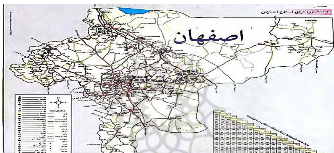
شکل ۲. موقعیت جغرافیایی منطقه مورد مطالعه

درجه و ۲۷ دقیقه عرض شمالی و ۴۹ درجه و ۳۸ دقیقه تا ۵۵ درجه و ۳۲ دقیقه طول شرقی در بخش مرکزی ایران در جلگه‌ای حاصلخیز و پربرکت واقع شده است که به‌طور خلاصه می‌توان گفت بیشتر شهرها و روستاهای آن حاصل جریان زاینده‌رود است. شکل استان از لحاظ گسترش در امتداد طول و عرض جغرافیایی به‌گونه‌ای است که میانگین طول آن ۵۳۲/۵ کیلومتر و عرض آن برابر با ۴۰۵ کیلومتر است. استان اصفهان از شمال به استان‌های مرکزی، قم و سمنان، از جنوب به استان‌های فارس و کهگیلویه و بویراحمد، از شرق به استان‌های یزد و خراسان و از غرب به استان‌های لرستان و چهارمحال و بختیاری محدود می‌شود. براساس آخرین تقسیمات کشوری در سال ۱۳۹۰، استان اصفهان ۲۳ شهرستان، ۴۵ بخش، ۱۰۳ شهر و ۱۲۵ دهستان دارد. جمعیت استان اصفهان طبق نتایج سرشماری نفوس و مسکن در سال ۱۳۹۵، برابر ۵۱۲۰۸۵۰ نفر، شامل ۲۵۹۹۴۷۷ نفر مرد و ۲۵۲۱۳۷۳ نفر زن بوده است که در ۱۶۰۷۴۸۲ خانوار زندگی می‌کنند (اداره کل میراث فرهنگی، صنایع‌دستی و گردشگری استان اصفهان، ۱۳۹۵).