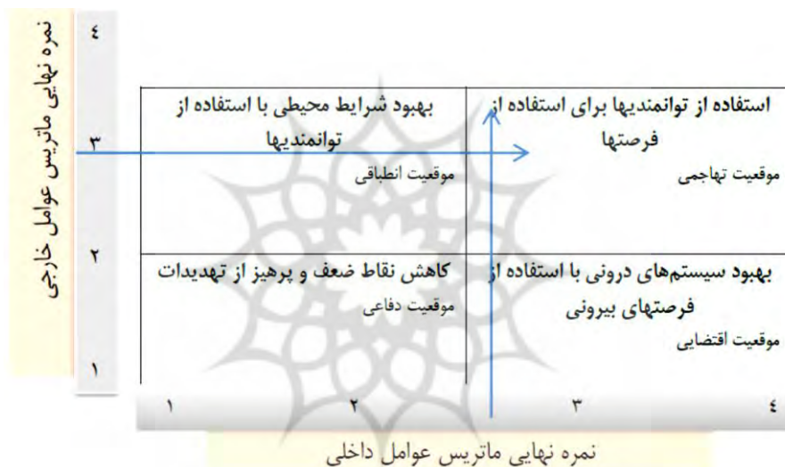
شکل ۱. موقعیت گردشگری بازار تاریخی تبریز در ماتریس داخلی- خارجی

با توجه به نتایج به‌دست‌آمده از تحقیق، وضعیت گردشگری بازار تاریخی تبریز در موقعیت تهاجمی- رقابتی قرار دارد و باید از توانمندی‌ها و پتانسیل‌های موجود در بازار و فرصت‌های پیش رو به نحو احسن استفاده کرد تا این بازار در امر گردشگری موفق باشد.