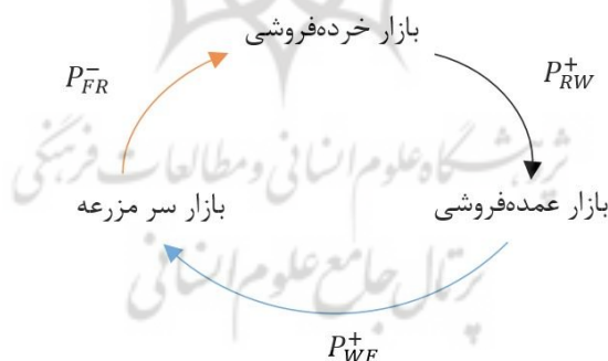
شکل (۱) چرخه انتقال قیمت در بازار برنج کامفیروزی

نتایج جدول (۶) و شکل (۱) نشان می‌دهد که در بازار برنج کامفیروزی، انتقال قیمت تنها از سطح عمده‌فروشی به سر مزرعه، از سطح خرده‌فروشی به عمده‌فروشی و از سطح سر مزرعه به خرده‌فروشی رخ می‌دهد. به صورت مشخص با افزایش قیمت سر مزرعه برنج کامفیروزی، قیمت خرده‌فروشی آن در دوره بعد کاهش می‌یابد. از دلایل این موضوع می‌توان به امکان عرضه مستقیم این محصول از بازار سر مزرعه به خرده‌فروشی آن به صورت خاص در بسیاری از نقاط شمال و مرکز استان فارس اشاره کرد.