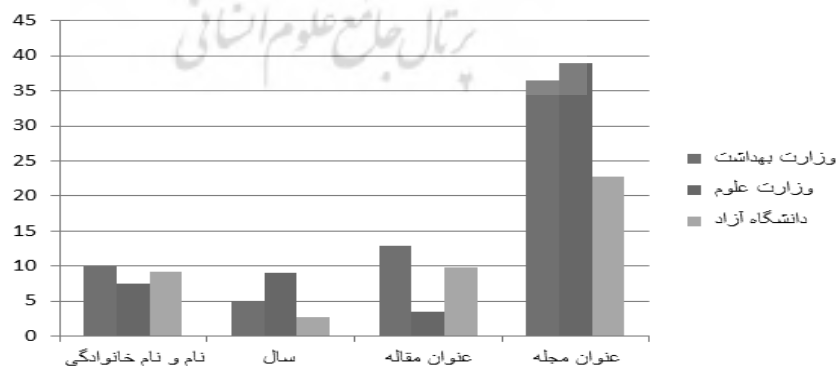
نمودار ۱. مقایسه اشکال‌های استخراج‌شده سه سازمان

مطابق جدول ۶ در مؤلفه اول اشکال‌ها یعنی نام و نام خانوادگی بیشترین اشکال مربوط به وزارت بهداشت (۱۰ درصد)، بعد از آن مربوط به دانشگاه آزاد اسلامی (۹/۲۳ درصد)، و سپس وزارت علوم (۷/۵۷ درصد) است. در مؤلفه سال، بیشترین اشکال مربوط به وزارت علوم با ۹/۰۹ درصد و به ترتیب وزارت بهداشت با ۵ درصد و دانشگاه آزاد اسلامی ۲/۷۱ درصد در مراتب کمتر اشکال قرار دارند. در مؤلفه عنوان مقاله، بیشترین اشکال وزارت بهداشت ۱۲/۸۵ درصد، سپس دانشگاه آزاد ۹/۷۸ درصد، و در آخر وزارت علوم با ۳/۵۳ درصد است. در آخرین مؤلفه یعنی عنوان نشریه، بیشترین اشکال با ۳۸/۸۸ درصد مربوط به وزارت علوم بعد با ۳۶/۴۲ درصد مربوط به وزارت بهداشت، و در آخر دانشگاه آزاد با ۲۲/۸۲ درصد قرار دارد. در مجموع، سه سازمان بیشترین اشکال مربوط به عنوان نشریه، سپس نام و نام خانوادگی، و در درجه بعدی عنوان مقاله و در آخر سال قرار داشته است (نمودار ۱).