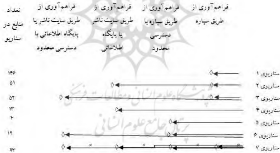
شکل ۱. سناریوهای دسترسی به منابع مخازن سازمانی دانشگاه‌های علوم پزشکی کشور

در این قسمت از یافته‌ها، سناریوهایی که مخازن سازمانی برای دسترسی به منابع فراهم آورده‌اند، معرفی می‌گردند. در مجموع ۷ سناریو وجود دارد. در سناریوهای ۱، ۲، ۳ و ۴ کاربران می‌توانند به متن کامل منابع دسترسی داشته باشند. به طوری که در سناریوی ۱، کاربران تنها از طریق پیوند درون مخزن سازمانی، به منبع مورد نظر دست می‌یابند. در سناریوی ۲، کاربران هم از طریق پیوند مخزن سازمانی و هم از پیوند سایت ناشر یا پایگاه‌های اطلاعاتی به متن کامل دست می‌یابند. در سناریوی ۳، کاربران از طریق مخزن سازمانی به متن کامل دسترسی می‌یابند ولی دسترسی محدود نیز از طریق سایت ناشر و پایگاه اطلاعاتی فراهم آمده است. در سناریوی ۴، کاربران با هدایت شدن به سایت ناشر یا پایگاه اطلاعاتی به منبع مورد نظر دست می‌یابند. سناریوی ۵ و ۶ دسترسی به منابع را محدود کرده‌اند. در سناریوی ۵، دسترسی محدود از طریق مخزن سازمانی وجود دارد و در سناریوی ۶، دسترسی نه تنها از طریق مخزن سازمانی محدود شده است بلکه به سایت ناشر یا پایگاه اطلاعاتی با دسترسی محدود پیوند داده‌اند. در سناریوی ۷ پیوندی برای دسترسی به متن کامل قرار نداده‌اند یا پیوند داده شده کور است و کاربران به هیچ طریقی نمی‌توانند به منابع دست یابند. همان‌طور که در شکل (۱) مشخص شده است تعداد منابع در سناریوی ۱ بیشتر از دیگر سناریوها است و مخازن سازمانی در بیشتر موارد دسترسی به متن کامل را از طریق سایت خودشان فراهم آورده‌اند. کمترین فراوانی مربوط به سناریوی ۵ است.