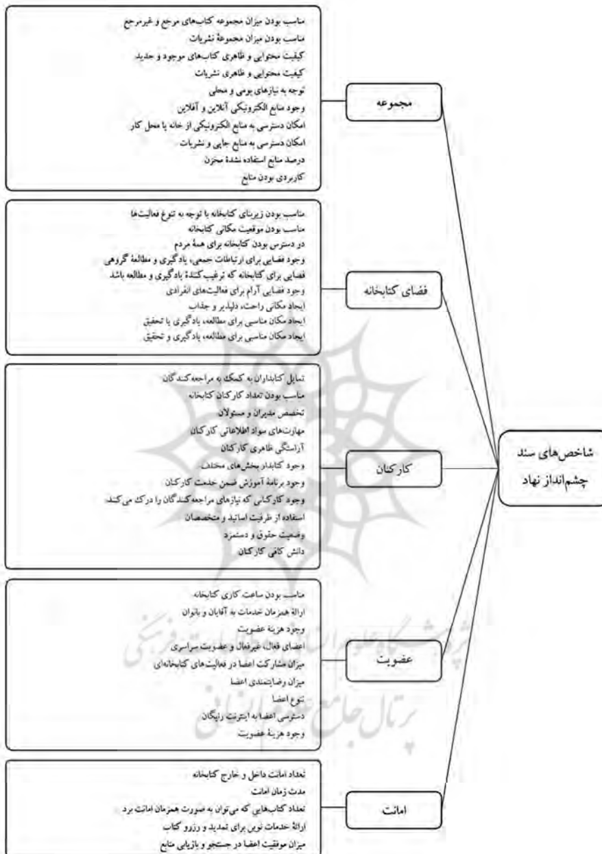
شکل ۱. گویه‌های شاخص‌های سند چشم‌انداز نهاد کتابخانه‌های عمومی کشور