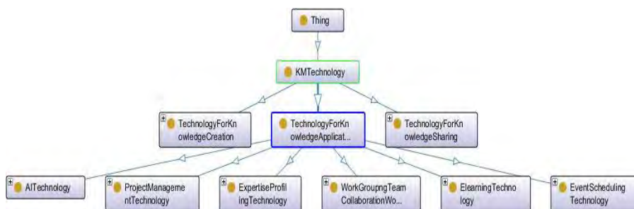
شکل ۴. گراف سطح بالای هستان‌شناسی فناوری‌های مدیریت دانش

ایجادشده در «پروتزه» هم در شکل ۵، آورده شده است.