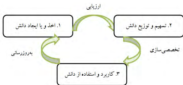
شکل ۱. چرخه مدیریت دانش (Dalkir 2005)