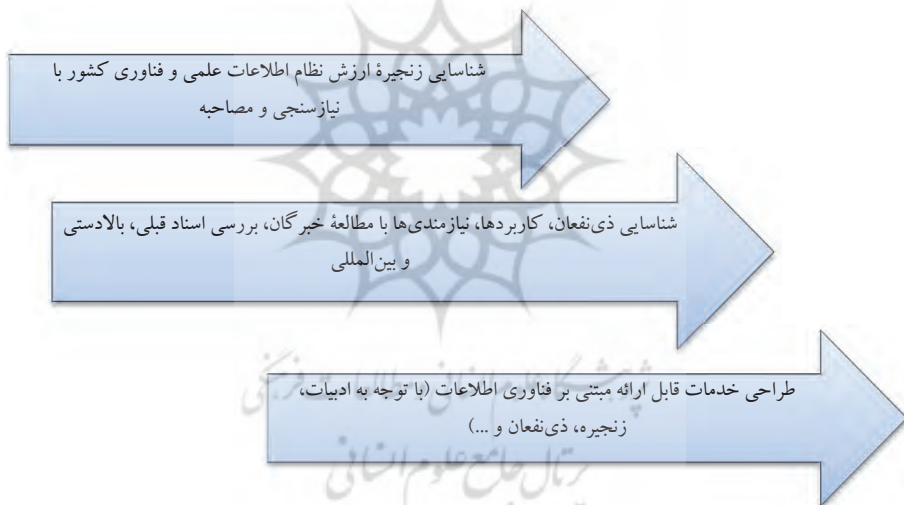
شکل ۲. فرایند انجام تحقیق

با توجه به رویکرد آمیخته در این مطالعه از چند روش کیفی استفاده خواهد شد. با توجه به گام‌های ذکر شده در شکل زیر، رویکرد تحقیق در این مقاله نظریه زمینه‌ای است. این رویکرد از جمله روش‌هایی برای پژوهشگر است که قصد شناخت منظم دیدگاه‌ها و معانی «روش نظریه زمینه‌ای» افراد در یک موقعیت خاص را دارند. این رویکرد پژوهشگر با به کارگیری روش‌های گوناگون جمع‌آوری اطلاعات و مطالعات رفت و برگشت میان نظریه (تحلیل داده‌ها) و واقعیت (گردآوری داده‌ها)، شناخت نظری دقیقی از پدیده مورد مطالعه برای تحقیق فراهم می‌کند. در زیر مراحل انجام این تحقیق آمده است.