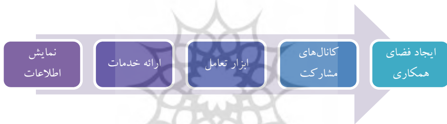
شکل ۱. روند توسعه خدمات دولتی (Sandoval-Almazan & Gil-Garcia 2012)

دانشمندان و محققان بر این باورند که مهم‌ترین فعل و انفعالات و معاملات میان شهروندان و دولت در سطح تراکنش‌های محلی اتفاق می‌افتد. این روابط می‌تواند بسیار نزدیک‌تر و به‌صورت مکرر با استفاده از فناوری‌های اطلاعات و ارتباطات (فاوا) تحقق یابد. به‌عنوان مثال، رسانه‌های اجتماعی و دیگر ابزارهای وب ۲ می‌توانند کانال‌های جدید الکترونیکی را برای این تعامل از طریق گنجاندن آن‌ها در پورتال دولت (محلی) ارائه کنند. شکل زیر روند توسعه خدمات دولتی را در فضای سیستم‌های عامل جدید مثلاً بر روی تلفن‌های همراه هوشمند نمایش می‌دهد: