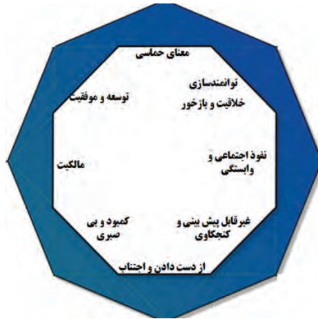
شکل ۲. رانه‌ها و ارتباط بین آن‌ها (Chou 2015)

معنای حماسی رانه ناظر بر این امر است که افراد زمانی کاری را انجام می‌دهند که بر این باور باشند که برای رسیدن به هدفی فراتر از اهداف شخصی باید فعالیت کنند و یا فردی انتخاب شده هستند. بهتر است قبل از هر درخواستی از مخاطب، برای وی روشن گردد که چرا باید فعالیت‌های تعیین شده را انجام دهد و یا چرا برای رسیدن به اهداف باید همکاری کند. از رانه استفاده‌های بسیاری شده است، به‌عنوان مثال در «ویکی‌پدیا» ۱ افراد مشارکت کننده به‌عنوان قهرمانان حافظ دانش بشری شناخته می‌شوند، در «ویز» ۲ کاربران برای از بین بردن غول ترافیک با هم همکاری می‌کنند و «اپل» ۳ با ایجاد مفهوم Apple People و Think Different به‌دنبال نهادینه کردن این شعار است که «با خرید «اپل» یک الهام و یا یک چشم‌انداز خواهید خرید». رانه توسعه و موفقیت بر این نکته تأکید دارد که ایجاد حس کنترل در مخاطب و دستیابی به اهداف تعیین شده یکی از بهترین عوامل برای ادامه فعالیت‌هاست؛ چرا که با ایجاد حس مثبت از کاهش فاصله با اهداف و ایجاد حس کنترل و تسلط در مخاطب، وی به پیش رانده می‌شود. نوار پیشرفت «لینکدین» ۴ ، صفحه جست‌وجوی «گوگل» و صفحه نتیجه جست‌وجو در «آمازون» را می‌توان از جمله