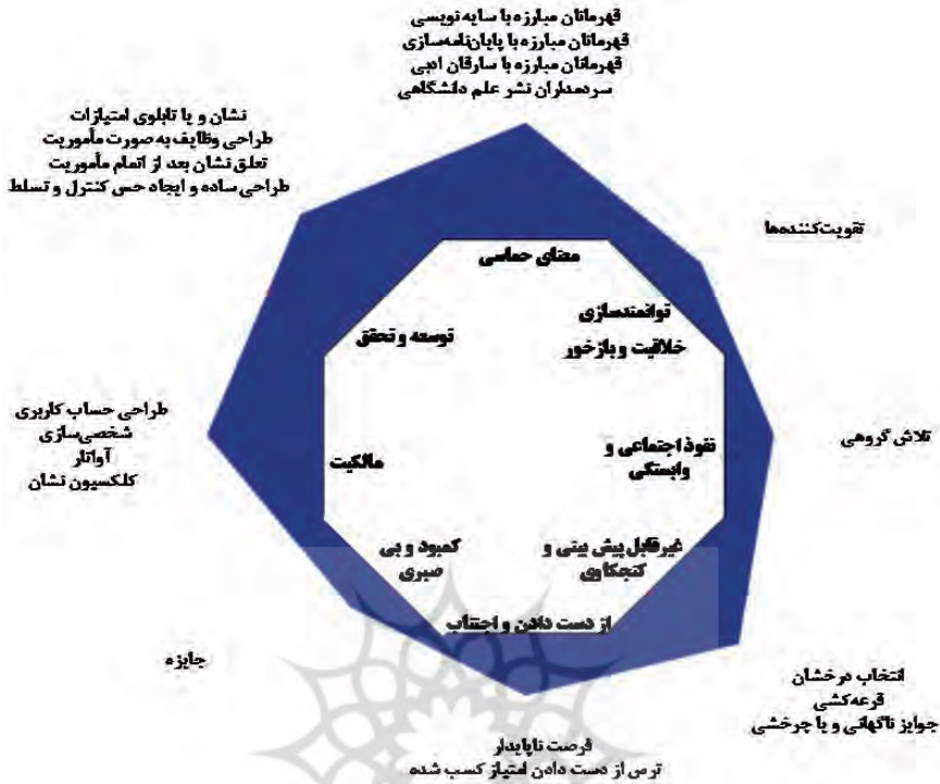
شکل ۳. رانه‌ها در سامانه ثبت

به‌طور خلاصه می‌توان عنوان کرد که رفتار مطلوب برای کاربران دانشگاهی «سامانه ثبت»، تأیید و یا عدم تأیید «پارسا»های موجود در کارتابل شخصی و اعلام نظر در خصوص آنهاست. طی اجرای این فرایند عموماً مشکلاتی رخ می‌دهد که سبب کاهش انگیزه و مشارکت کاربران می‌شود. این مشکلات شامل مشخص نبودن چرایی، تکراری و کسالت‌آور بودن فعالیت‌ها و سردرگمی در انجام فعالیت‌ها بوده و باید تلاش نمود تا با بهره‌گیری از رانه‌های مطرح‌شده و وجوه طراحی مربوطه روش‌هایی اجرایی پیشنهاد گردد که زمینه تحقق رفتار مطلوب فراهم آید. ارتباط بین رفتار مطلوب، مشکلات موجود، رانه‌های متناسب برای رفع آنها و وجوه طراحی به همراه روش‌های اجرایی در جدول ۱، ارائه شده است.