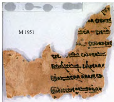
تصویر شماره ۲