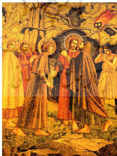
تصویر شماره ۶