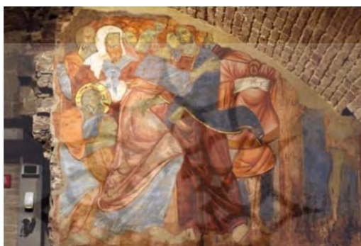
تصویر شماره ۵