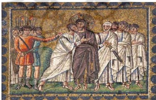
تصویر شماره ۱